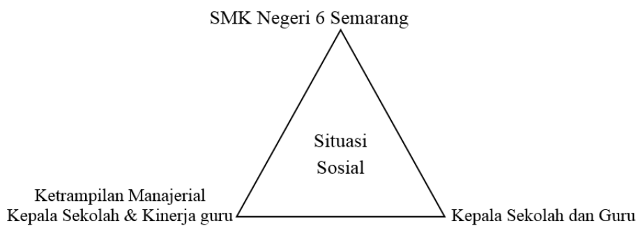
Gambar 2 : Teknik Cuplikan

Dalam penelitian ini teknik pemilihan informan menggunakan cuplikan yang bersifat purposive sampling , peneliti cenderung memilih informan yang yang dianggap tahu dan dapat dipercaya seutuhnya sebagai sumber data yang mantap serta mengetahui permasalahan secara mendalam (Sugiono, 2008).