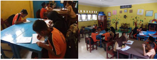
Gambar 10. Mensketsa di atas kertas