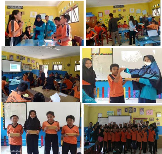
Gambar 5. Suasana pembelajaran pada pertemuan pertama

Setelah selesai pada tahapan awal, pengantar mengenai proses desain rekayasa kepada peserta, maka pelatihan dilanjutkan dengan tahapan berikut.