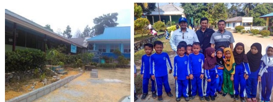
Gambar 4. Lingkungan Sekolah dan SiswaSDN 004 Teluk Sebong Kabupaten Bintan

kelas. Kondisi wilayah sekitar merupakan daerah pertanian dan sebagian besar orang tua siswa bermata pencaharian sebagai petani dan buruh. Siswa-siswi SD Negeri 004 Teluk Sebong, 80 % penduduk aslinya suku Jawa, 20 % masyarakat Tionghoa. Karena orang tuanya bekerja sebagai petani, hubungan sosial lingkungan terjalin sangat harmonis. Siswa siswi SD Negeri 004 Teluk Sebong dalam perkembangan akademis (nilai akademis/koqnitif), 70% dapat mengikuti dengan baik, sesuai KKM yang ditetapkan. Pada Gambar 4, menampilkan lingkungan sekolah dan siswadi SDN 004 Teluk Sebong.