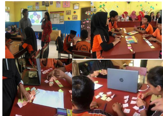
Gambar 8. Pengelompokan yang dilakukan secara langsung sesama anggota kelompok untuk menentukan permasalahan utama

Setelah mengumpulkan permasalahan-permasalahan yang ada di sekolah, selanjutnya akan dilakukan pengelompokan untuk menentukan permasalahan utama nantinya.