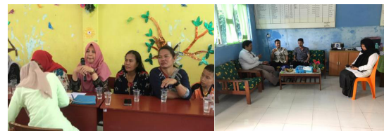
Gambar 12. Orang tua siswa dan Guru memberikan masukan mengenai pelatihan yang sudah diberikan selama 7 minggu pertemuan

Keuntungan utama dari purwarupa virtual adalah pembuatan purwarupa dari konsep inovasi untuk pengujian awal tidak diperlukan karena setiap penyesuaian akan dilakukan secara langsung dalam realitas virtual dengan mempergunakan simulasi. Purwarupa dapat di eksplorasi secara virtual dan interaktif, selanjutnya dapat dipelajari dan disimulasikan sebelum implementasi di dunia nyata [11]. Setelah selesai Edutech for Children , mahasiswa sebagai fasilitator memberikan kesempatan kepada orang tua siswa untuk memberikan tanggapan terkait pelatihan yang sudah diberikan selama beberapa minggu, sila lihat pada Gambar 12.