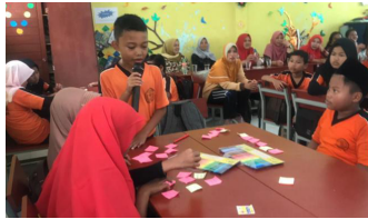
Gambar 9. Proses curahan gagasan untuk mendorong siswa dalam memberikan solusi secara bebas

Tahapan selanjutnya adalah proses divergence terhadap permasalahan utama. Beberapa konsep solusi akan diutarakan melalui proses brainstorming bersama anggota lainnya dengan mempergunakan kertas untuk menulis atau menggambar solusi. Pada akhir tahapan ini adalah pemilihan satu konsep solusi yang akan dikerjakan pada tahapan selanjutnya. Solusi utama yang diambil adalah merupakan solusi yang akan berdampak luas untuk masyarakat nantinya.