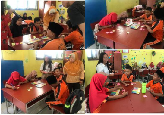
Gambar 7. Siswa dan siswi melakukan curahan gagasan menggunakan post it

Pada Gambar 7 menunjukkan suasana yang santai dan fun akan menghasilkan dorongan terhadap siswa dan siswi untuk mampu menemukan permasalahan-permasalahan di sekitarnya dengan lebih baik. Fasilitator akan membantu menyediakan peralatan yang diperlukan agar Brainstorming secara cepat. Pola penyampaian gagasan melalui brain storming sangat diperlukan untuk memotivasi siswa mampu berpikir inovatif dan kreatif. Curahan gagasan yang bersifat luas ( divergence ) adalah merupakan pondasi untuk inovasi yang berbasis teknologi, hal ini sering dipahami dengan T concept di dalam bidang rekayasa, dimaksudkan bahwa inovasi yang dihasilkan memiliki pengaruh yang luas dan mendalam. Adapun aturan-aturan di dalam brainstorming adalah menghindari penilaian secara langsung dan membantah ide yang sedang disampaikan., mendorong adanya ide-ide yang luar biasa/aneh, berpikir seperti anak kecil dimana tidak takut akan kesalahan., mengedepankan kuantitas daripada kualitas., mempertahankan semua