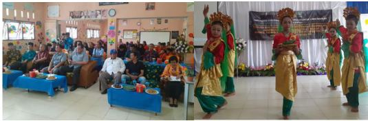
Gambar 1. Acara Pembukaan Pelatihan Edutech for Children di Kabupaten Bintan