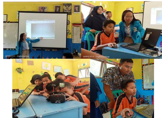
Gambar 6. Mahasiswa berintegrasi langsung dengan siswa

pendataan mengenai pola hidup masyarakat tersebut yang akan dijadikan sebagai masukan untuk inovasi berbasis teknologi. Dengan metode observasi yang berbasis etnografi, peneliti akan dapat mengumpulkan data secara lengkap dengan melihat dan mengalami secara langsung peristiwa dan kondisi apa yang terjadi, hal ini sangat dianjurkan karena kesulitan yang dialami oleh pengguna untuk mengekspresikan kebutuhan dan keinginan mereka [6]. Pada Gambar 6 menunjukkan mahasiswa sebagai fasilitator pelatihan berintegrasi langsung dengan siswa, melakukan kegiatan yang sama dan memberikan pandangan-pandangan yang diperlukan untuk melatih siswa dan siswi dalam melakukan observasi terhadap lingkungan sekitarnya.