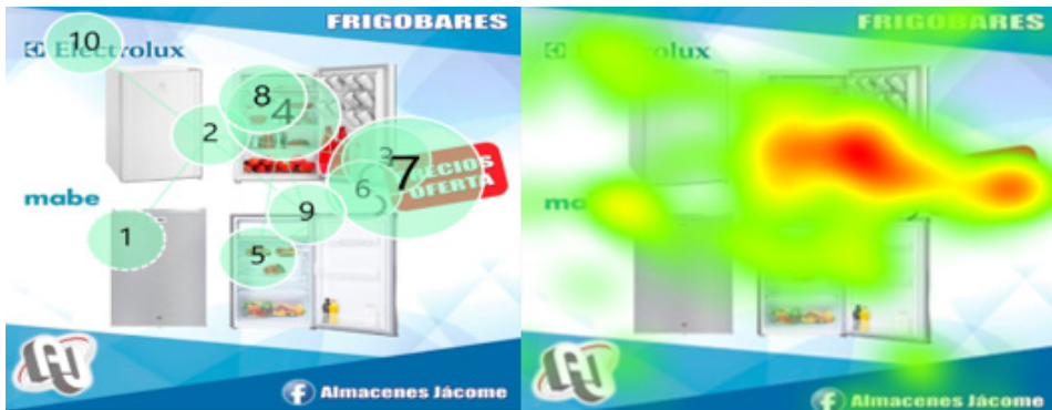
Figura 1. Zonas de calor publicidad