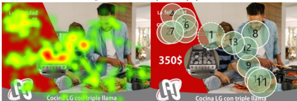
Figura 2. Zonas de calor publicidad propuesta

El enganche de la publicidad (tabla 9) se dio en el segundo 0,42 en el elemento del frigorífico 2 de la parte superior de la imagen por el contenido del color rojo que es el que llama mayormente la atención y por tanto también es el elemento de mayor impacto alcanzando 1,07 segundos. Sin embargo, el elemento con mayores visitas a pesar de no tener impacto es la marca del establecimiento AJ en la elipse.