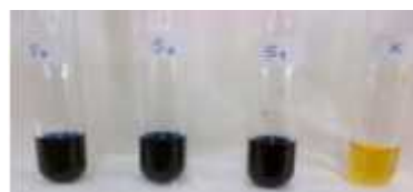
Gambar 5.3 Hasil uji yodium

Uji yodium dilakukan untuk mengidentifikasi adanya polisakarida (pati) dalam sampel tepung sago. Hasilnya dapat dilihat pada Gambar 5.3