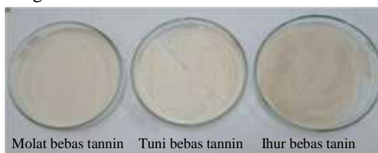
Gambar 5.2 Tepung sago bebas tannin

Tepung sago umumnya mengandung tannin yang diduga dapat menghambat hidrolisis enzim, maka pada pembuatan tepung sago dibuat juga tepung sago bebas tannin dengan cara tepung pati sago yang diperoleh dicampur dengan etanol dan distirer selama 6 jam. Hasilnya dapat dilihat pada gambar 5.2