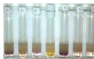
Gambar 5.4 Hasil uji molisch; (kiri ke kanan) Sampel ihur bebas tannin, molat bebas tannin, tuni bebas tannin, kontrol (aguades), sampel tepung tuni, sampel molat, dan sampel ihur.

Uji molisch secara kualitatif menentukan adanya karbohidrat dalam sampel tepung sago. Hasilnya positif pada sampel tepung sago dan tepung sago bebas tannin yang ditandai dengan terbentuknya cincin ungu antara sampel dan asam sulfat. Hasil diperlihatkan pada Gambar 5.4