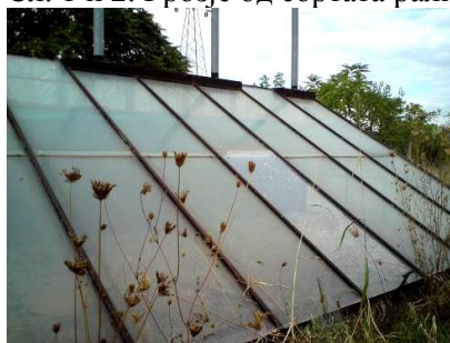
Сл. 3. Ерменска сушилница