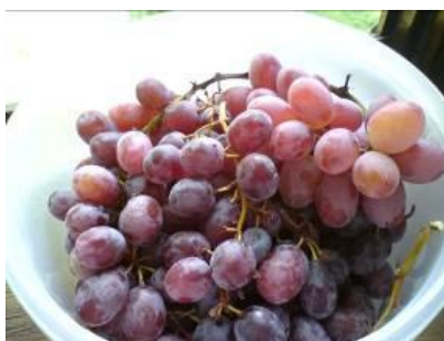
Сл. 1 и 2. Грозје од сортата рали