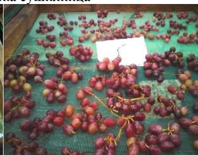
Сл. 4 и 5. Сушење на грозјето од сортата рали во ерменска сушилница