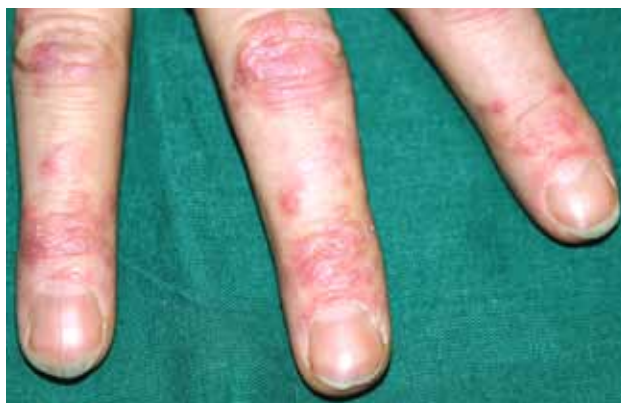
Рис. 5. КВ вследствие обморожений