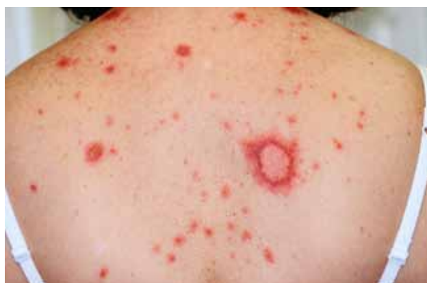
Рис. 8. Кольцевидная подострая КВ