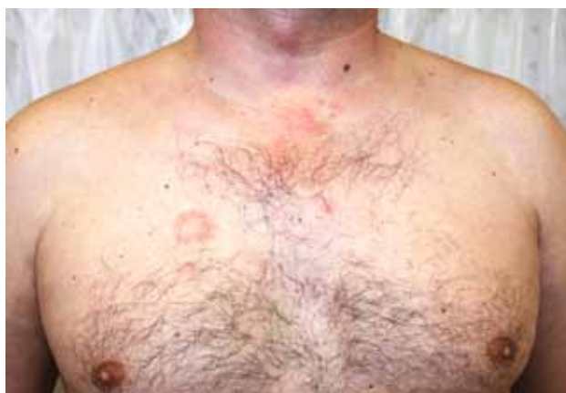
Рис. 6. Опухолевидная КВ