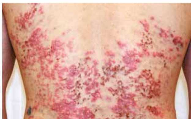
Рис. 9. Буллезная подострая КВ