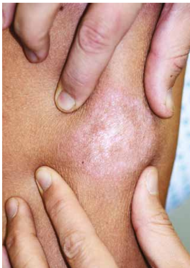
Рис. 3. Распространенная дискоидная КВ