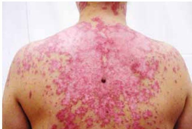
Рис. 7. Папуло-сквамозная подострая КВ

Буллезная КВ — очень редкая форма заболевания, которая развивается в результате поражения аутоантителами волокон коллагена VII типа в области эпидермо-дермального сочленения. На внешне неизменной коже или на фоне эритем, преимущественно на участках, подвергавшихся инсоляции (лицо, шея, разгибательные поверхности плеч, верхняя часть спины и груди) появляются многочисленные мелкие пузырьки или крупные пузыри с напряженной крышкой и серозным содержимым (рис. 9). Возможно образование буллезных элементов на слизистых оболочках. При разрешении высыпаний формируются вторичные гиперпигментные пятна или рубцы. Развитие буллез-