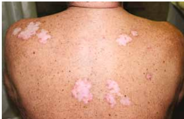
Рис. 4. Глубокая КВ

Опухолевидная КВ рассматривается рядом авторов как хроническая кожная форма КВ, другие относят ее к промежуточной форме заболевания [19, 20, 24, 30, 31]. Клиническая картина представлена высыпаниями на коже в виде плотных уртикарноподобных папул и бляшек красного цвета (от розового до синюшного), округлой, неправильной или кольцевидной формы, имеющих четкие границы, с блестящей поверхностью, которые локализуются на участках, подвергающихся инсоляции, — в области верхней части груди, спины, плеч, шеи, лица (рис. 6). Иногда элементы могут сливаться, образуя полициклические фигуры. Обострение заболевания чаще наблюдается в весенне-летний период. Высыпания могут спонтанно бесследно разрешаться спустя несколько недель или существовать длительно. Часто наблюдаются ежегодные обострения заболевания после пребывания на солнце с повторным появлением элементов на одних и тех же местах [30, 32].