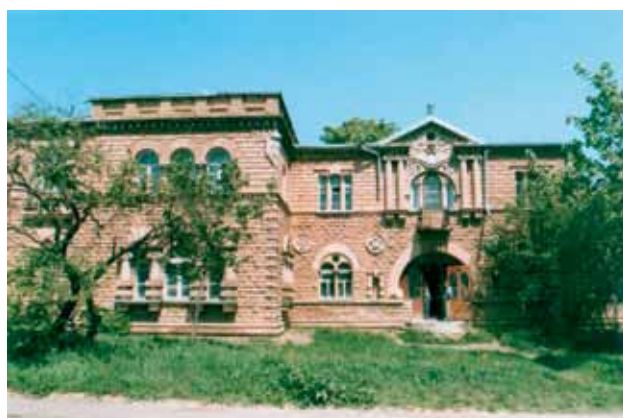
Кожное отделение на 70 коек на базе краевой больницы (1943—1975 гг.)