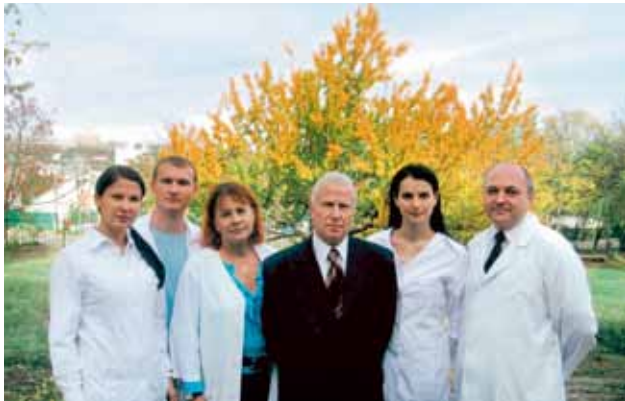
Коллектив кафедры дерматовенерологии и косметологии