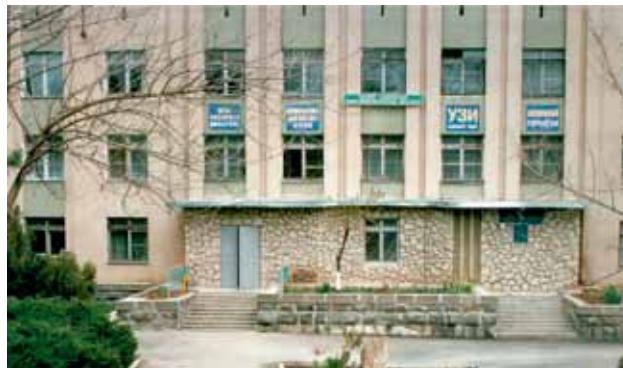
ГБУЗ «Краевой клинический кожно-венерологический диспансер»