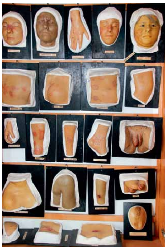
Муляжи (в зале ожидания)