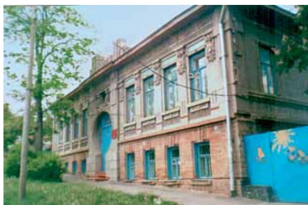
Поликлиника диспансера (1941 г.)

С 1965 по 1974 г. проводилось строительство здания нового КККВД по ул. Достоевского 52, где и ныне базируется государственное бюджетное учреждение здравоохранения Ставропольского края «Краевой клинический кожно-венерологический диспансер» с филиалами в городах Георгиевске, Ессентуках, Кисловодске, Невинномыске, Пятигорске.