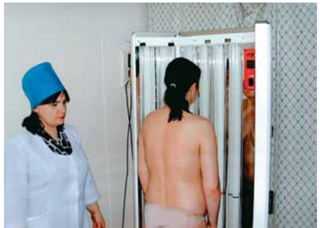
Сеанс селективной фототерапии

В настоящее время КККВД — мощное медицинское учреждение, оснащенное современным диагностическим и физиотерапевтическим оборудованием (УЗИ, аппарат для ПУВА и селективной фототерапии, урологическая установка «Яровит», ПЦР Real Time и многое другое).