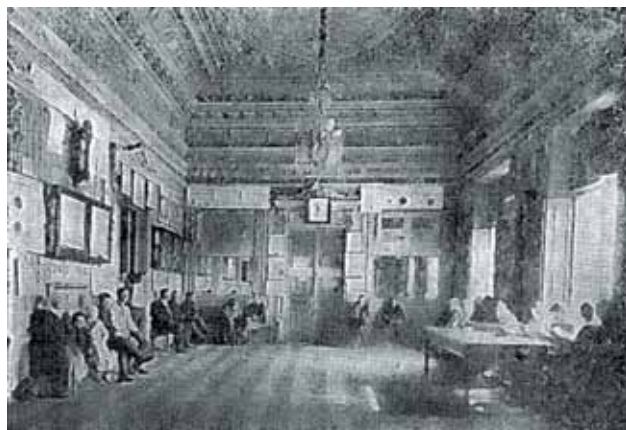
Ожидальня Венерологического института