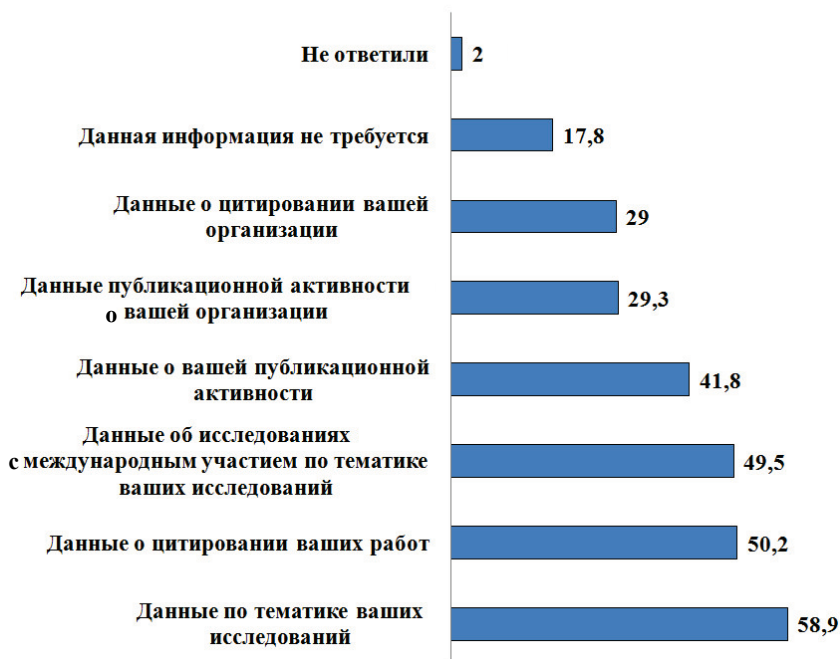
Рис. 2. Распределение потребностей ученых ПНЦ РАН в различных видах библиометрической информации (%)

Подобный интерес со стороны научного сообщества и администраций институтов способствовал тому, что в анализ были включены БД, разрабатывающие наукометрические показатели.