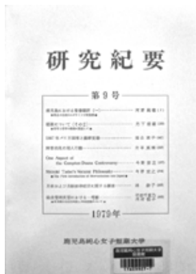
図3 通巻第9号の表紙