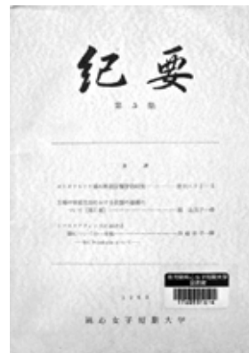
図1 純心女子短期大学紀要第4集(通巻第1号)の表紙

通巻1,2号となる「純心女子短期大学紀要」第5集、第6集の表紙には「紀要」とのみ表記され(図1)、奥付の誌名欄には「純心女子短期大学『紀要』」と記載されている。