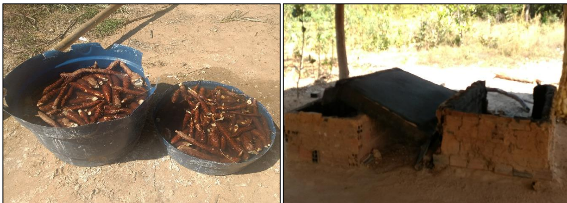
Figura 03 - Mandioca para fazer farinha e forno