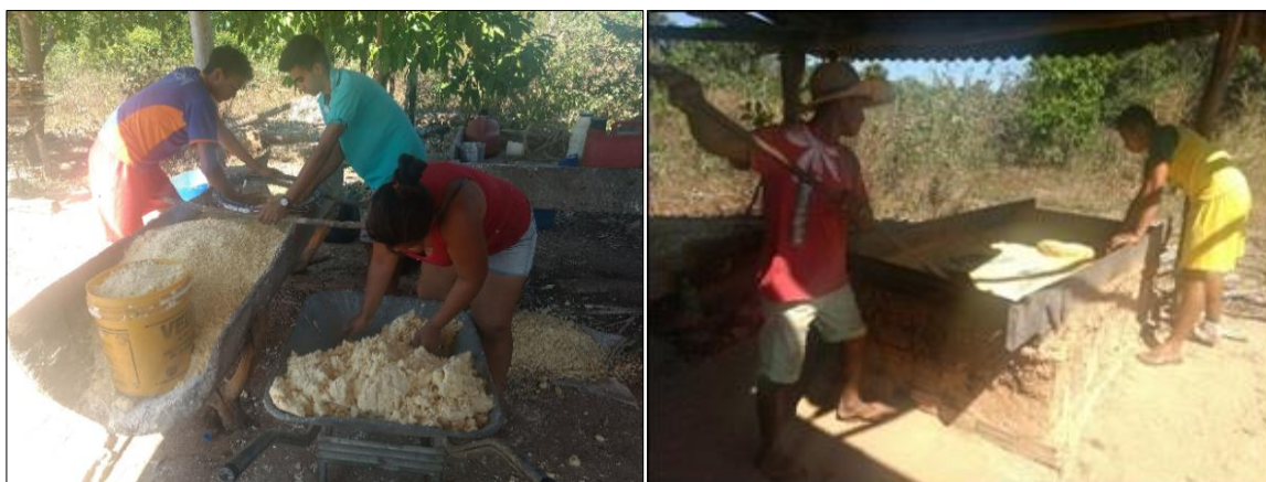
Figura 04 - Produção da farinha – secagem e cozimento no forno de barro

A primeira etapa consiste em colocar a mandioca de molho na água ainda com a casca, conforme a figura 03 que também apresenta o forno, este feito com tijolos e barro. Antigamente, o forno de barro era construído com paredes de taipa. Depois de descascada, a mandioca é ralada e prensada para secar. A secagem da massa pode ser feita no tapiti (figura 04) ou na prensa conhecida como jirau de vara, a secagem é feita com o auxílio de uma peneira, conforme a figura 05. O trabalho é realizado sempre em equipe, sendo cada integrante responsável por alguma etapa.