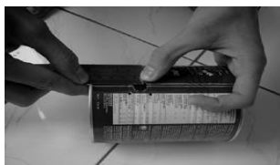
Gambar 5. Mengukur titik waveguide