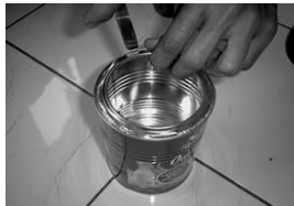
Gambar 3. Membersihkan seng (kaleng) dan meratakannya