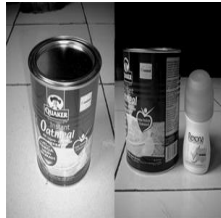
Gambar 2. Kaleng sebagai bahan pembuatan antenna