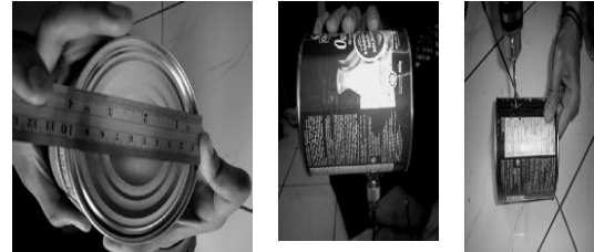
Gambar 6. Memasang kabel konektor