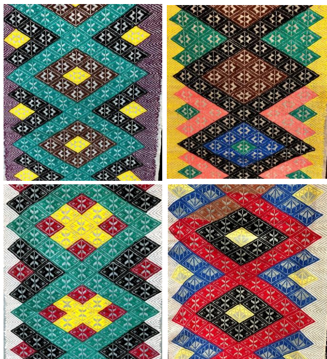
写真3 古作四種（アミューズミュージアム所蔵）

2019年3月、東京都アミューズミュージアム開催「南部さしこ展」において三巾前垂れの古作調査を行った。本展では、民俗学者田中忠三郎が青森県内で収集した三巾前垂れの古作が展示された。代表的な模様構成パターンの柀刺し・井桁・ココノマワシ・ミズフキ四種全てを確認したほか、南部菱刺しの特徴である色彩構成バリエーションの事例を収集した。同じ構成パターンであっても色彩構成の違いで全く異なる印象を与える（写真3）。製作者の個性を表現するファクターとして色彩構成の重要性が分かった。