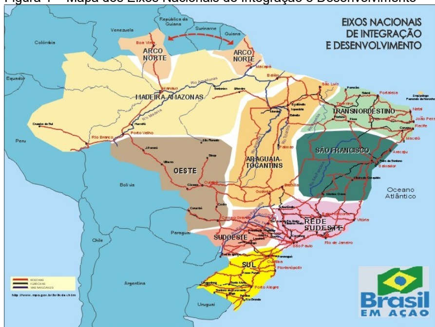
Figura 1 – Mapa dos Eixos Nacionais de Integração e Desenvolvimento

Após a definição dos eixos foram formulados os diagnósticos, consistiu no levantamento de problemas existentes e potenciais em infraestrutura econômica, transportes, comunicações e energia. O que gerou um portfólio de investimentos de acordo com a regionalização dos eixos no mapa brasileiro.