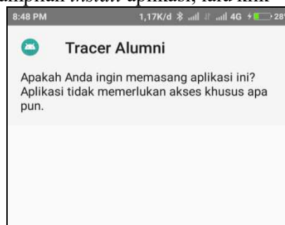
Gambar 2 Pemasangan Aplikasi tracer Alumni

Setelah proses install selesai maka muncul tampilan Login Aplikasi Tracer Alumni STMIK AUB Alumni dapat login dengan memasukkan username dan password .