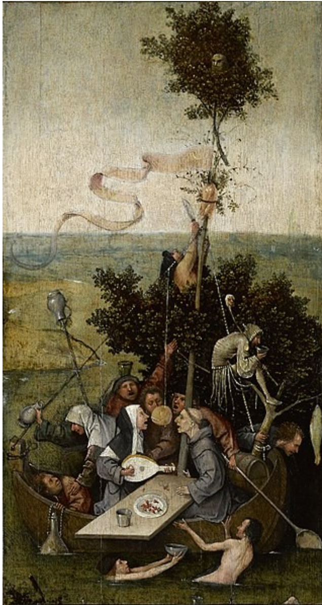
fig. 1 - H. Bosch, La nave dei folli

La suora suona il liuto, sembra che entrambi cantino, mangiano frutta golosa, hanno davanti un bicchiere, c'è una