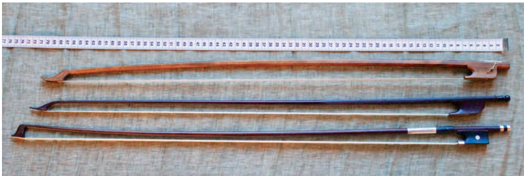
Figur 1: Øverst ser vi en nylaget kortbue av bjørk laget av Sigvald Rørlien (f. 1946) fra Voss. I midten en barokkbue av fernambuk laget av profesjonell barokkbuemaker i Praha – en buetype som brukes av barokkfiolinister i dag. Nederst en standard moderne fiolinbue av fernambuk, omtalt som langbue i denne sammenhengen.

Kortbuen her er ifølge Rørlien laget med inspirasjon fra flere gamle norske kortbuer, med streng og sagtakket beinstykke på froschen for hårstramming. Den er egentlig ikke spesielt kort med sine 70 cm (mot husets langbuer 73,5–74,5 cm). For å få plass i de små felehusene man hadde før, bør de ikke være mer enn 65 cm. Den veier bare 36 gram (mot husets langbuer 60–65g), og den har lite hår. I motsetning til dagens fiolinbuetype (her langbuen), er stokken på kortbuen i oppstrammet tilstand konkav i forhold til buehåra, og det er egentlig hovedforskjellen på kortbue og langbue. Konkaviteten ser man i sideplan som på bildet. Kortbuen (og barokkbuen) lages som en rett stokk og blir bøyd som en pilbue når den strammes opp. Ingeleiv Kjerland Kvammen (f. 1932) kaller kortbuen «tunnebogje» (tønnebue) etter formen. Hårene slakkes vanligvis ikke ned etter hver gang man har spilt med den, slik man må med langbuen for at stokken ikke skal miste spennet.