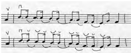
Figur 6: To takter av springaren « Signe Ulladalen ».

Figur 6 viser øverste linje i vanlig notasjon av et par takter fra Suldalspringaren « Signe Ulladalen », med de punkterte åttendelsfigurene med strøk på tvers av pulsen.