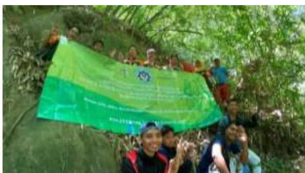
Gambar 5. Sosialisasi Eksplorasi Sapta Pesona Daya Tarik Batu Meja

Dari kedua gambar terlihat rute setapak menaiki dan menuruni bukit yang cukup ekstrem dan masih alami belum terjamah tangan manusia, dan berpotensi dijadikan adventure-tourism (out bond) dan juga edu-tourism .