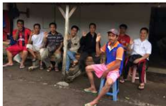
Gambar 2. Diskusi dan sosialisasi Sapta Pesona dengan warga dan pemuda

Penerapan Sapta Pesona merupakan salah satu langkah tepat dalam memberikan pemahaman bagi masyarakat khususnya warga Dusun Lider, dengan demikian masyarakat dapat mengelola destinasi pariwisata secara aktif dan efektif.