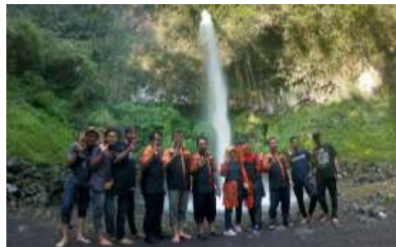
Gambar 3. Sosialisasi dan Eksplorasi Air Terjun Lider dengan Pokdarwis

Instagram, facebook, WhatsApp , dan website Himpunan Mahasiswa Pariwisata yang ada di kampus Politeknik Negeri Banyuwangi dengan demikian pamor Air Terjun Lider akan meningkat kembali sehingga memberikan dampak positif ke warga Dusun Lider.