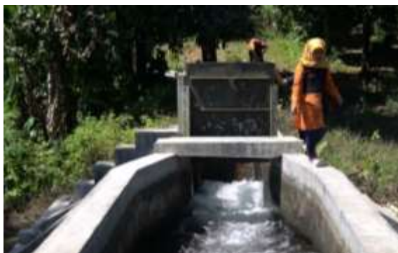
Gambar 7. Tempat pertemuan aliran air PLTMH