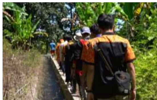
Gambar 6. Perjalanan menelusuri aliran PLTMH

Kebutuhan listrik warga Dusun Lider bergantung pada Pembangkit Listrik Tenaga Mikro Hidro, memang tidak besar akan tetapi dapat memenuhi kebutuhan 2 RT dan 1 RW warga Dusun Lider, mengingat warga hidup dilingkungan tanah HGU milik perusahaan swasta yang bergerak di bidang perkebunan cengkeh. Beberapa warga memiliki ide kreatif untuk membuat daya tarik wisata baru dengan memanfaatkan aliran air Listrik Tenaga Mikro Hidro menjadi pemandian anak-anak dengan dilakukan beberapa perubahan-perubahan yang menarik, sehingga dapat menarik pengunjung yang hadir ke Dusun Lider.