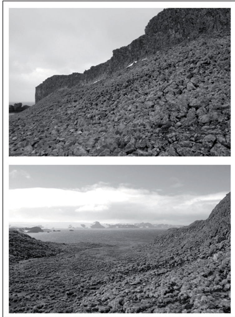
Fig. 2: Fotografías del entorno de la BCAA, península Fildes, isla Rey Jorge, Antártida. Se observan los parches de vegetación con límites claros.