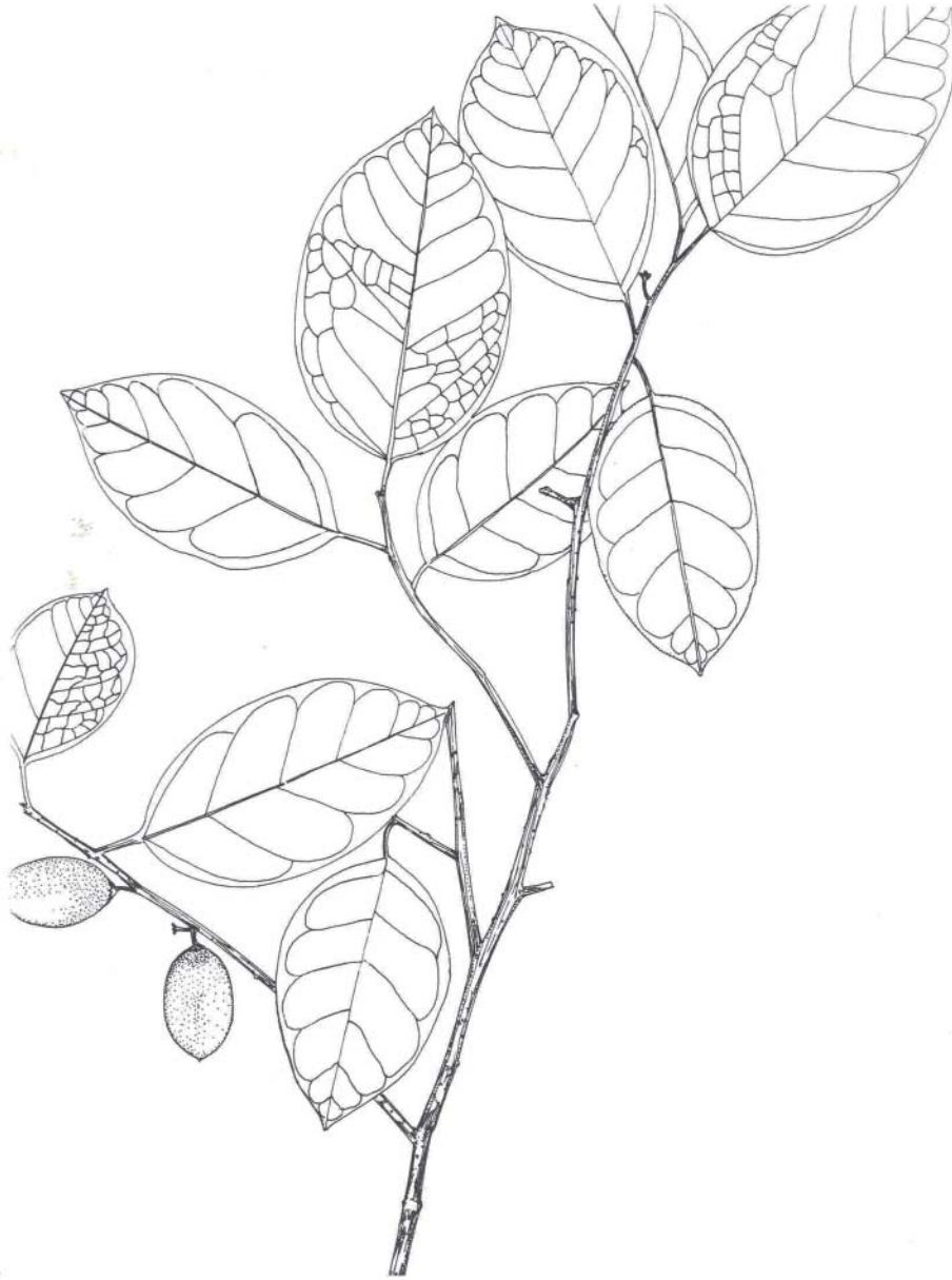
Fig. 2. Dibujo de una rama de Ottoschulzia pallida Lundell mostrando frutos y hojas (por Rita Alfaro Bates).