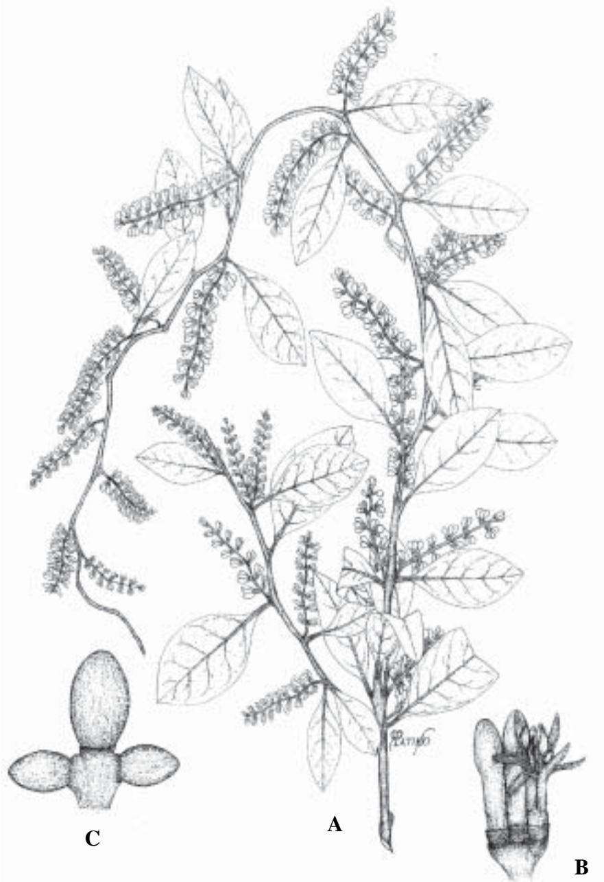
Fig. 4. Struthanthus interruptus (HBK) Bunme. A) Planta con flores (Cházaro et al. , 4773); B) Detalle de flor (Cházaro et al. , 4773) (XAL); C) Fruto (Cházaro et al. , 5898) (IEB).