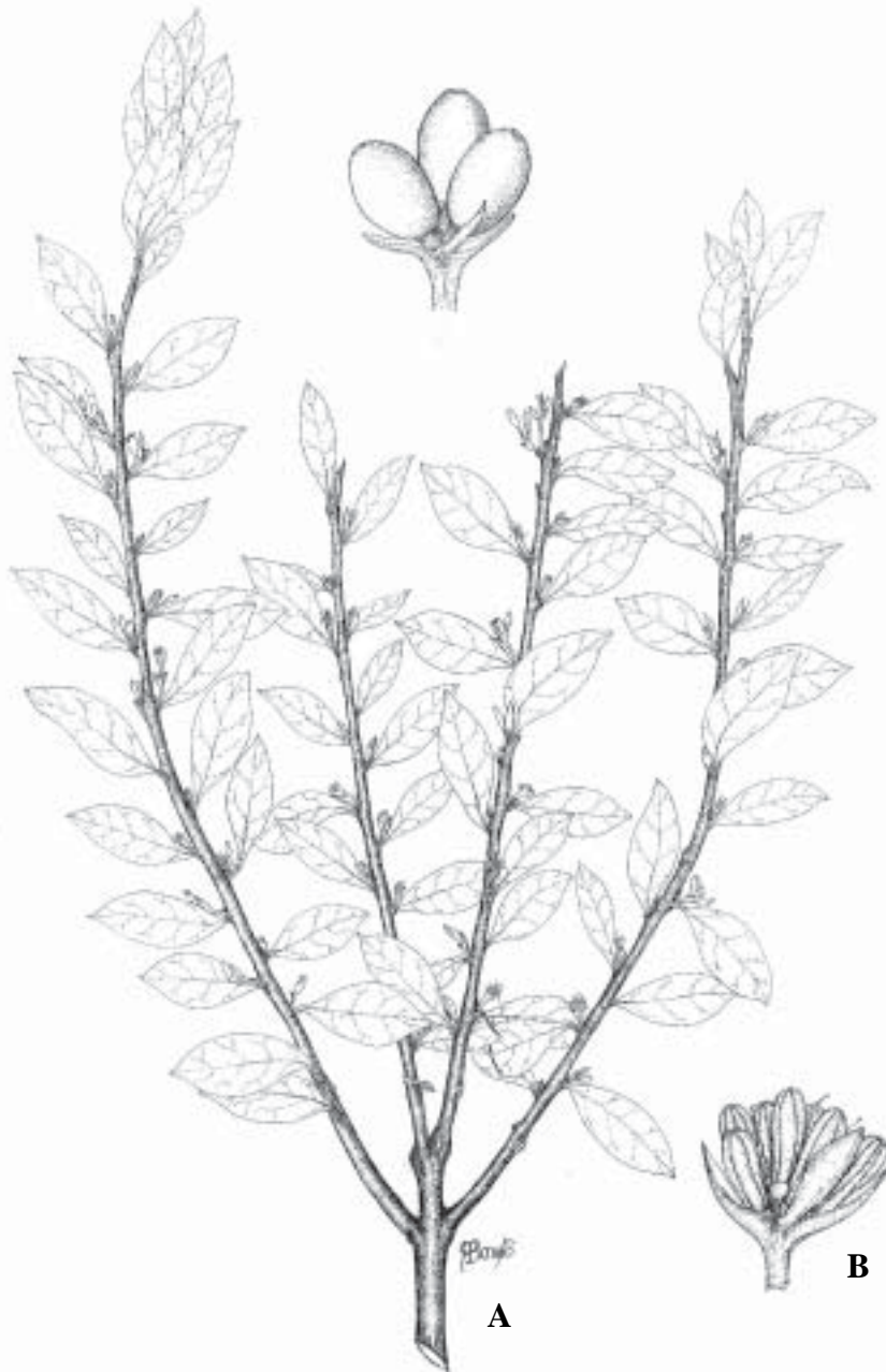
Fig. 3. Cladocolea loniceroides (Van Tieghem) Kuijt. A) Rama con frutos. M. Cházaro et al. , 4543; B) Flor. R. Ornelas et al. , 929 (XAL).