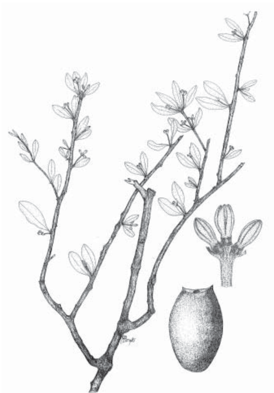
Fig. 1. Cladocolea oligantha (Standl. & Steyer.) Kuijt. A. Flor (J.A. Machuca 6543) (XAL). B. Fruto M. Cházaro B. 6482 (IEB).