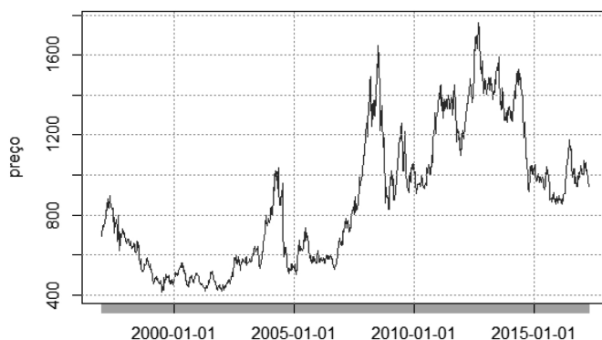
Figura 1 - Preço do primeiro contrato futuro em US$ cents/bushel

A Figura 1 apresenta o gráfico do primeiro contrato futuro F_1 . Alguns momentos do mercado chamam a atenção. Primeiro, os picos dos preços ocorrem antes e após a crise financeira em setembro de 2008. Segundo, após 2005, há uma tendência clara de aumento dos preços (trata-se da financialização). Terceiro, no segundo semestre de 2014, há uma forte queda nos preços. Tais movimentos são observados na maioria das séries de preços das commodities .