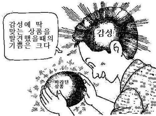
Gambar 2. Kansei (Nagamachi & Lokman, 2011).

dimanifestasikan dalam pernyataan “saya akan membelinya”, maka itulah Kansei yang sebenarnya. Visualisasi proses ini ditampilkan dalam Gambar 2 berikut.