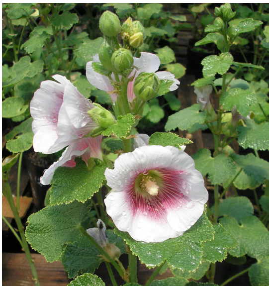
Figura 2. Corola de una de las plantas de Althaea rosea tratada con 16 h de luz.

16 h de fotoperíodo (Tabla 1), lo que sugiere que con esta práctica cultural el productor podría beneficiarse económicamente concentrando sus envíos para la venta.