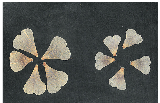
Figura 4. Imágenes de scanner de pétalos de plantas de Althaea rosea con 16 h de fotoperíodo (izquierda) y con luz natural (derecha)