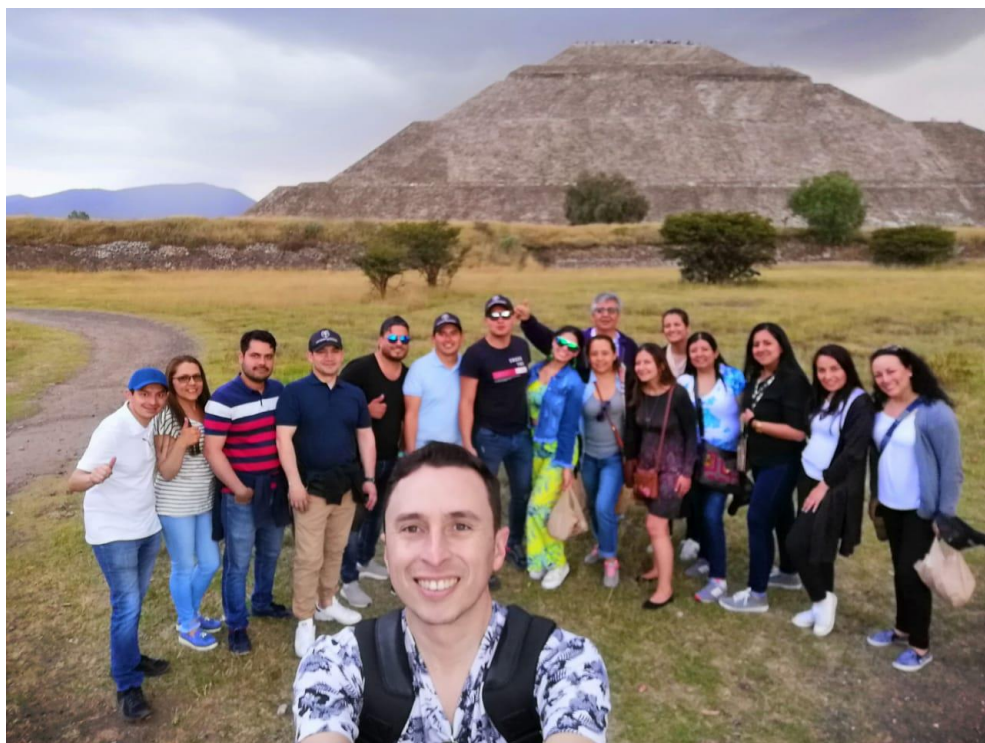
Imagen 8 (Teotihuacán. 2019), Pirámides Teotihuacán