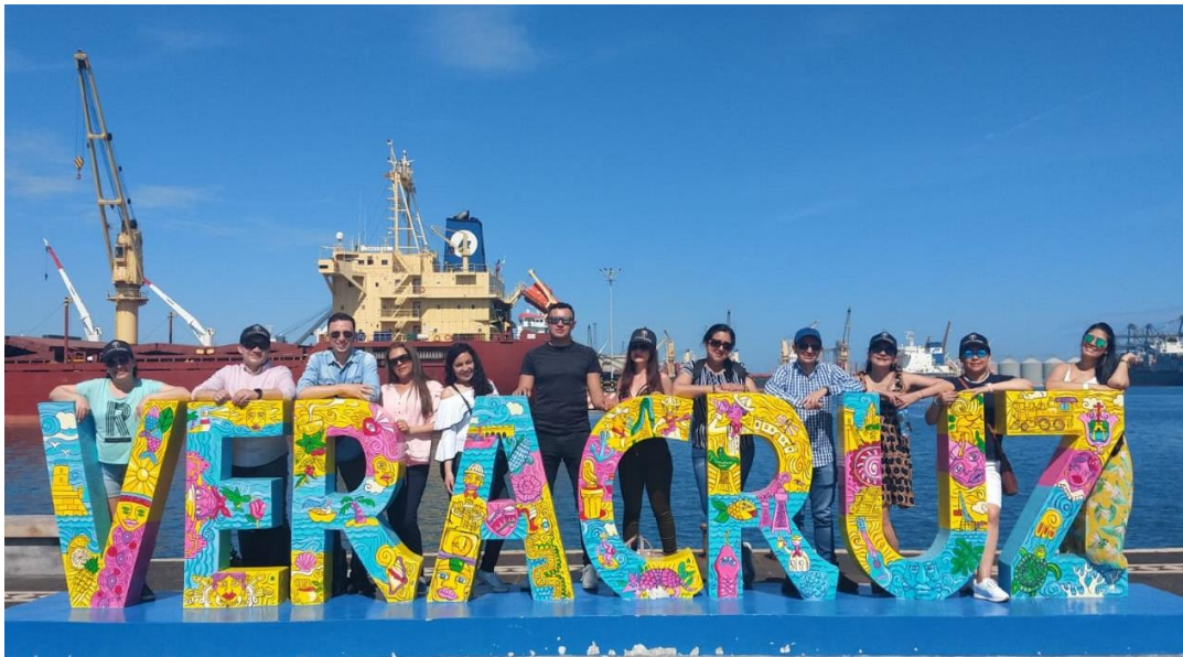
Imagen 10 (Veracruz. 2019), Puerto Veracruz