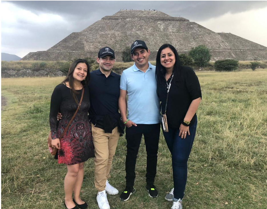
Imagen 9 (Teotihuacán. 2019), Pirámides Teotihuacán