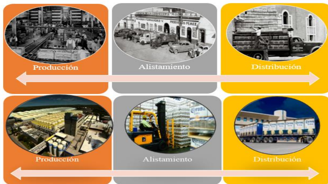
Figura 1. Tomas fotográficas de las fases de producción, alistamiento y distribución