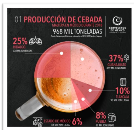
Figura 5. Producción de cebada, recuperado de http://cervecerosdemexico.com/industria-cervecera-infografias/

Gracias a este fenómeno de crecimiento y expansión del grupo Modelo a través de su producto Corona el campo mexicano ha sido uno de los más beneficiados puesto que dentro de la economía, se convirtieron en parte esencial del proceso, las cosechas de cebada aumentaron, los agricultores obtienen mayor beneficio por hectárea y económico por su trabajo mejorando así, el impacto económico del país.