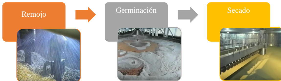
Figura 3. Procesamiento de la cebada. Elaboración propia con base en el video recuperado de

https://www.youtube.com/watch?v=ShuGvCtTMO4