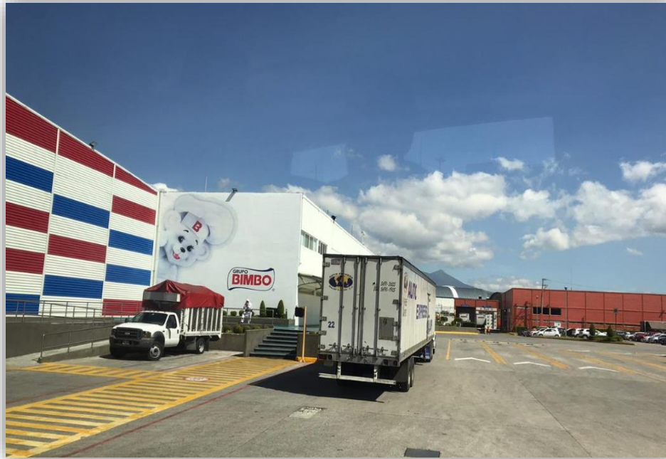
Fotografía 12 Panificadora BIMBO