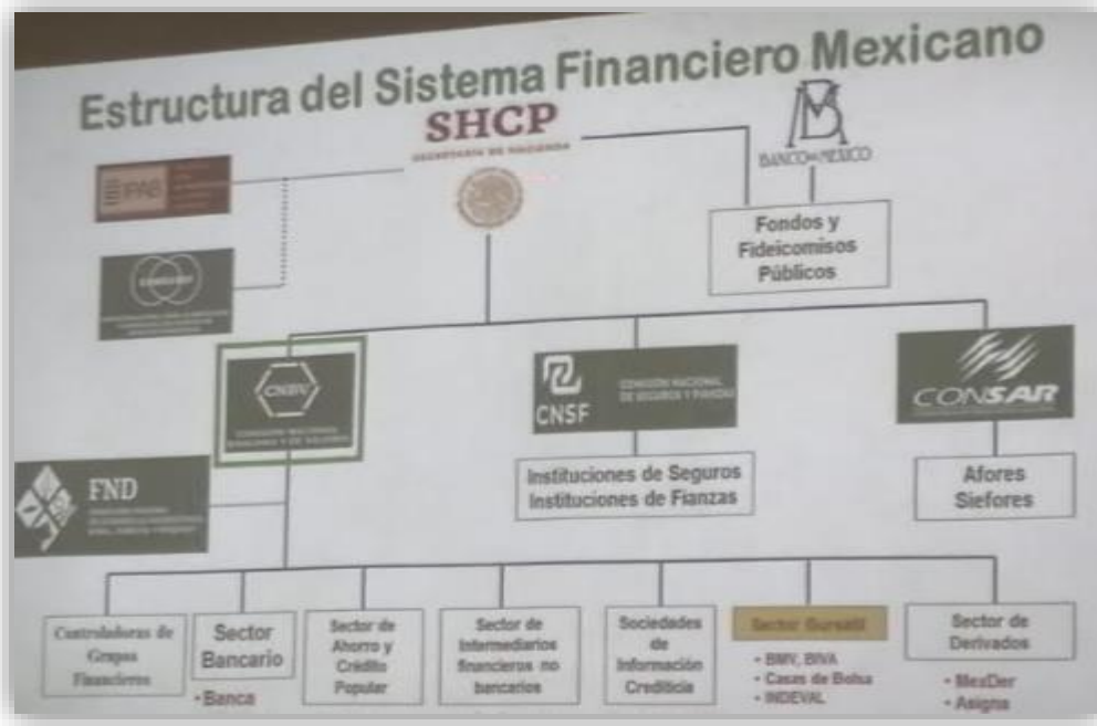
Fotografía 3 Estructura del Sistema Financiero Mexicano