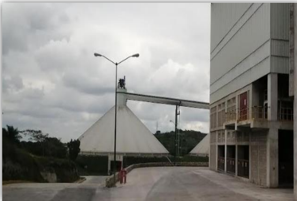
Fotografía 8 Domos, Cementos Moctezuma