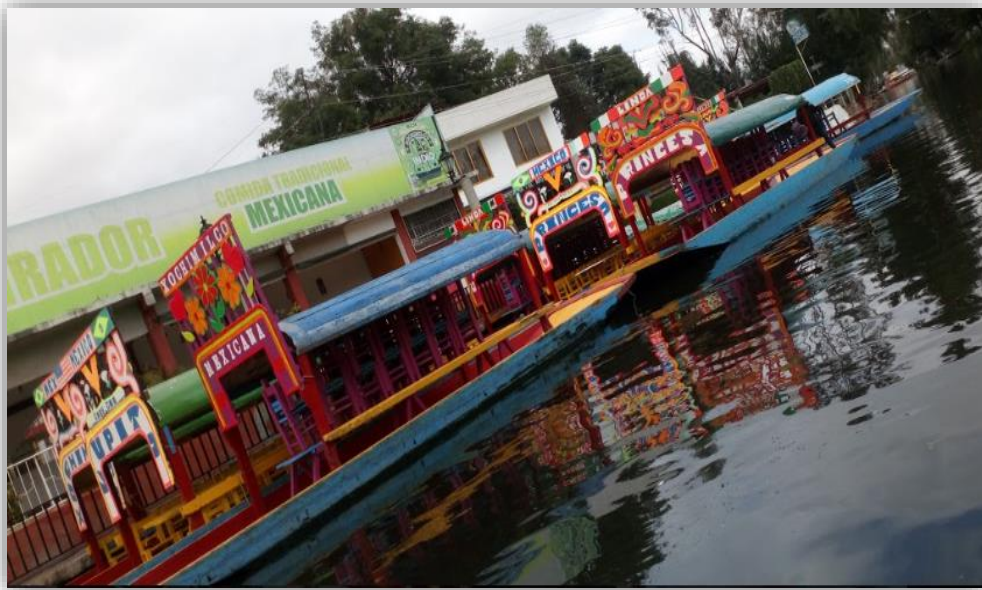
Fotografía 19 Trajineras de Xochimilco