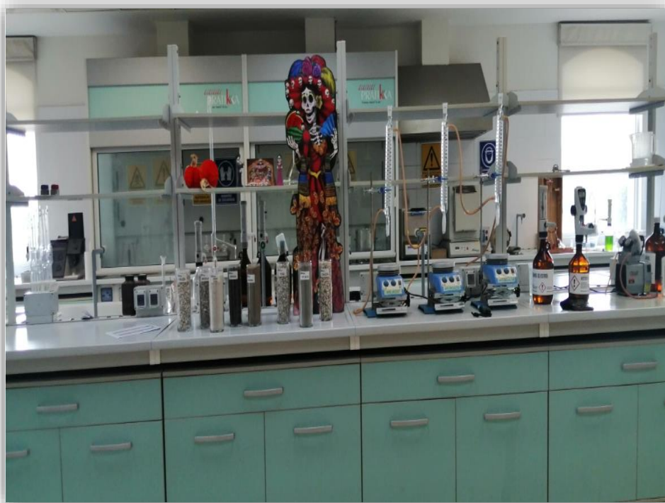
Fotografía 5 Laboratorio, Cementos Moctezuma

telescopios, etc., y se producen a capacidad máxima 8.000 toneladas de cemento diariamente.