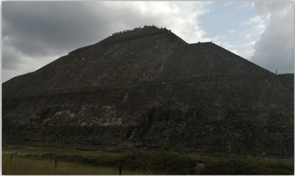
Fotografía 18 pirámides de Teotihuacan