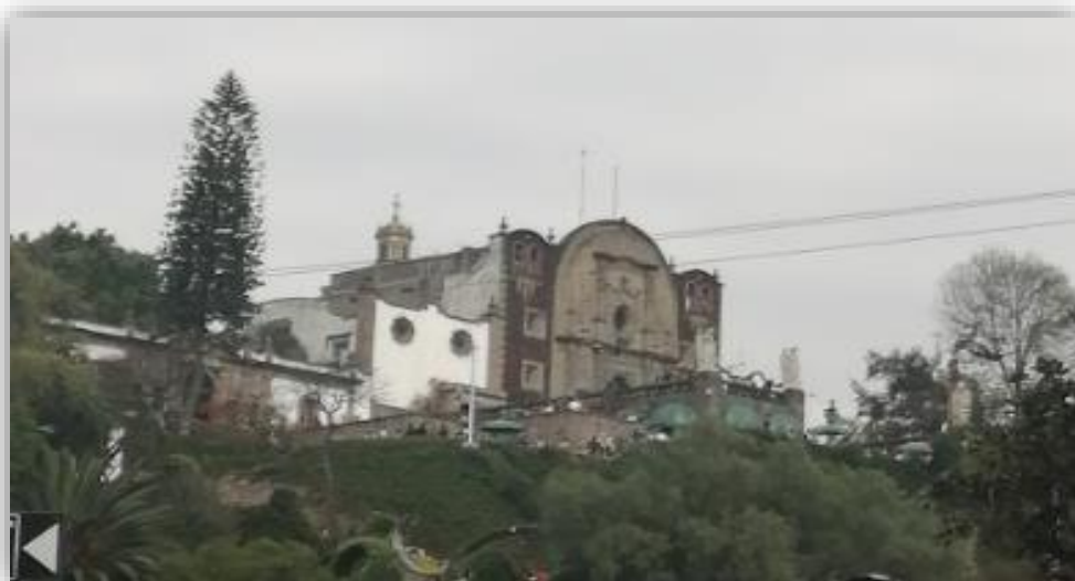
Fotografía 21 catedral de Guadalupe “antigua”