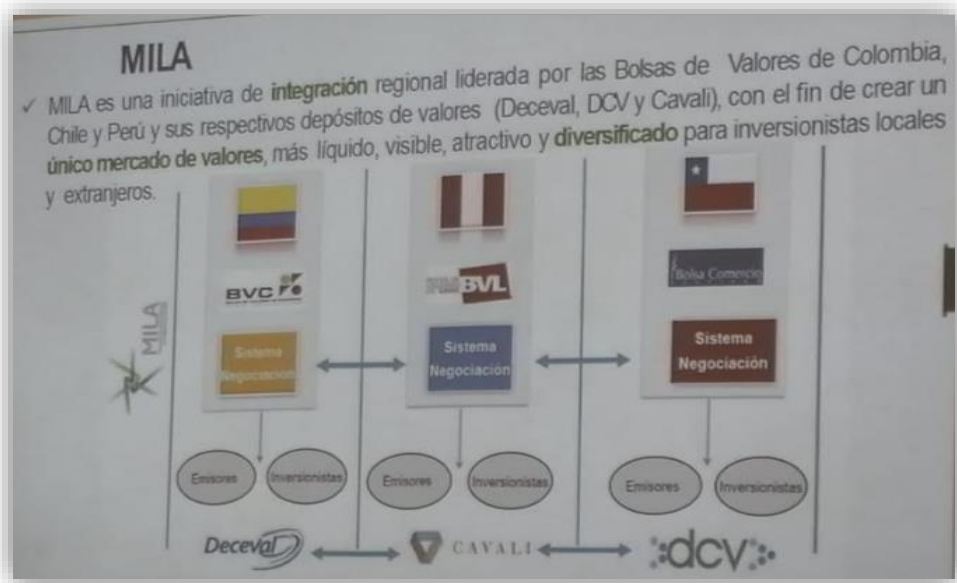
Fotografía 2 MILA Integración Bolsas de Valores

2015, México se incorpora al mercado integrado Latinoamericano (MILA Chile, Perú, Colombia, México)