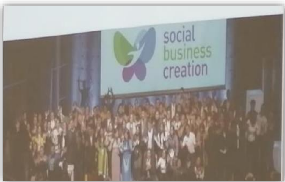
Fotografía 1 Social Business Creation

Adicionalmente se resaltó la experiencia de una de las estudiantes de Administración de la Universidad, con su participación en el torneo “Learn Entrepreneurship Create Social Ventures Make Positive Impacts”, como herramienta para la exploración de ideas innovadoras de emprendimiento social que generen impactos positivos en la sociedad.