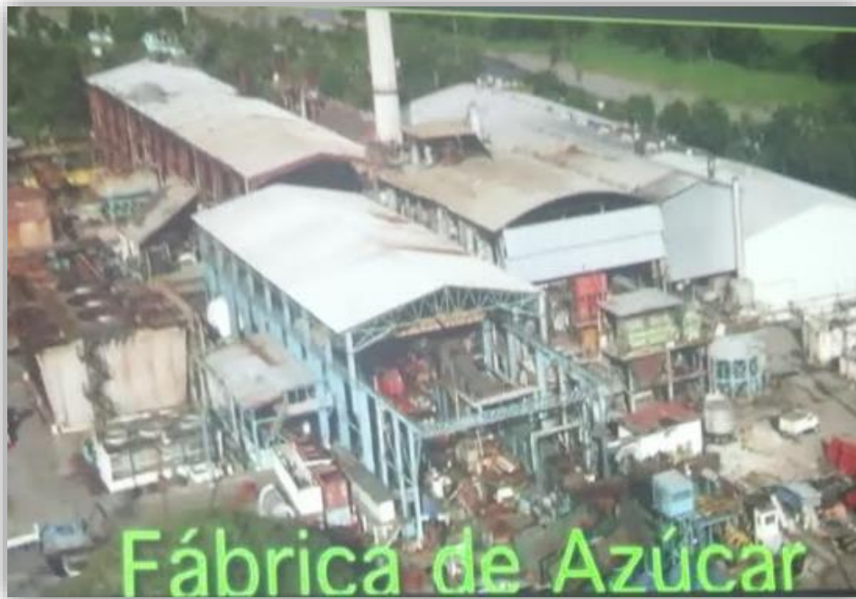
Fotografía 11 Fabrica Azúcar, Ingenios la Gloria