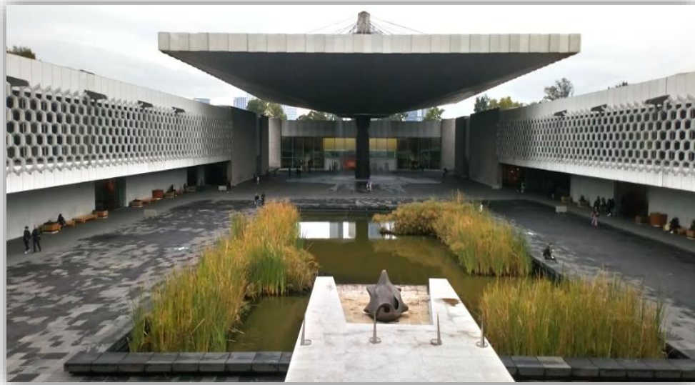
Fotografía 20 Museo Nacional de Historia