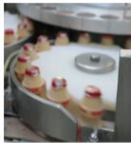
Fotografía 13 Proceso de Producción, Yakult

El envase del producto se fabrica con poliestireno aprobado para uso alimenticio.