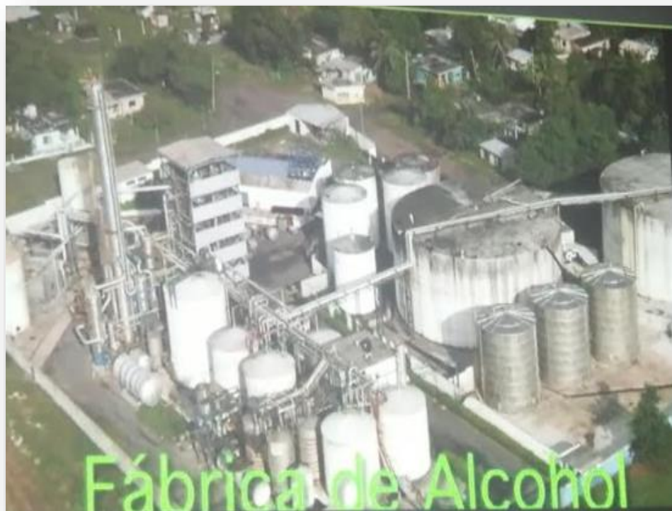
Fotografía 10 Fabrica Alcohol, Ingenios la Gloria