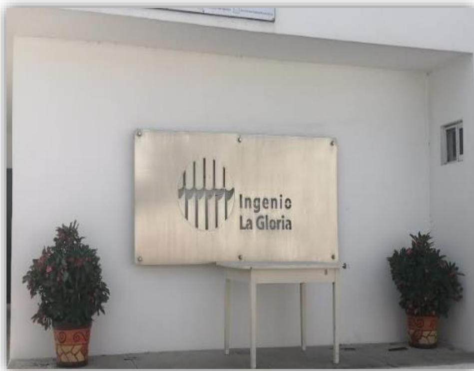
Fotografía 9 Ingenio La Gloria