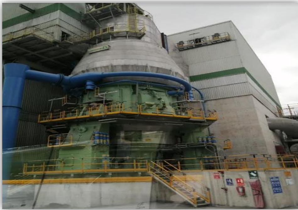
Fotografía 7 Hornos Rotatorios, Cementos Moctezuma