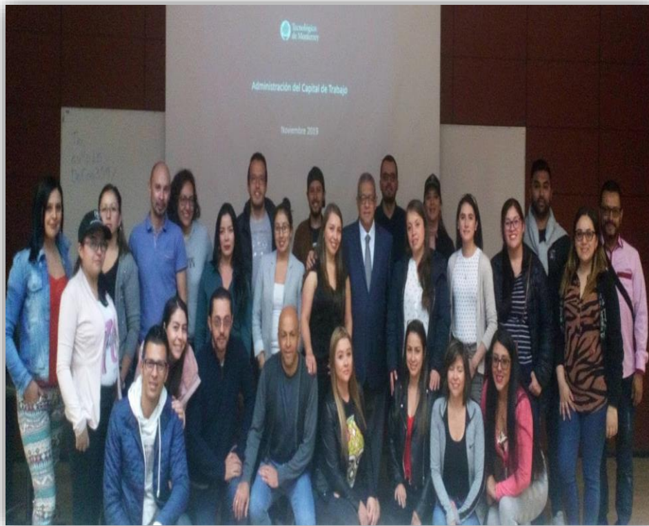
Fotografía 4 Tecnológico de Monterrey