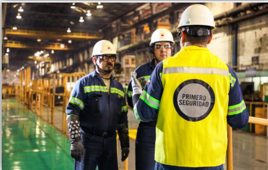
Fotografía 15 Planta Producción, Ternium