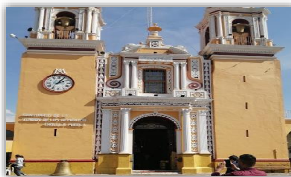
Fotografía 17 santuario de la virgen de los remedios Puebla