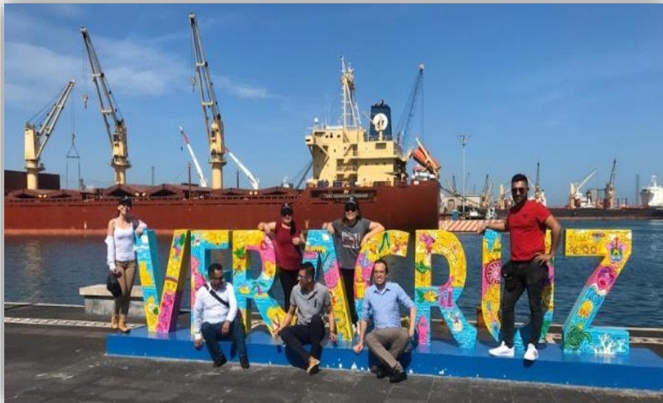
Fotografía 16 puerto de Veracruz

Entre los sitios visitados se resaltan la Catedral de Guadalupe, Museo Nacional de Historia, El santuario de la virgen de los remedios en Cholula, las pirámides de Teotihuacan, las Trajineras de Xochimilco, entre otros.