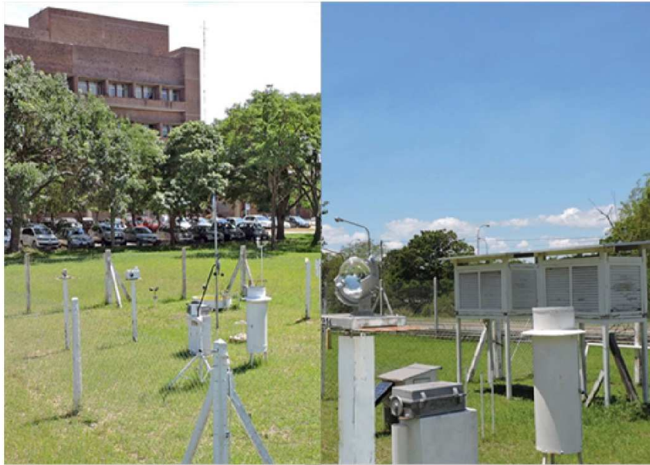
Foto 1. Detalle de la estación meteorológica del CIM.

municipales en lo referente a nuevo equipamiento y sistemas de comunicaciones; apoyo didáctico a profesores y alumnos de diferentes estamentos.