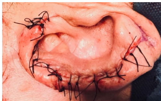
Figura 6. Cierre y reconstrucción.