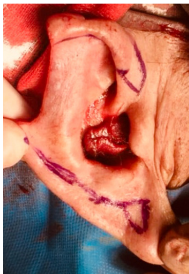
Figura 3. Diseño del colgajo de Antia-Buch.