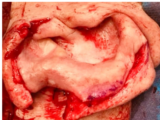
Figura 4: Incisión y despegamiento de colgajo.