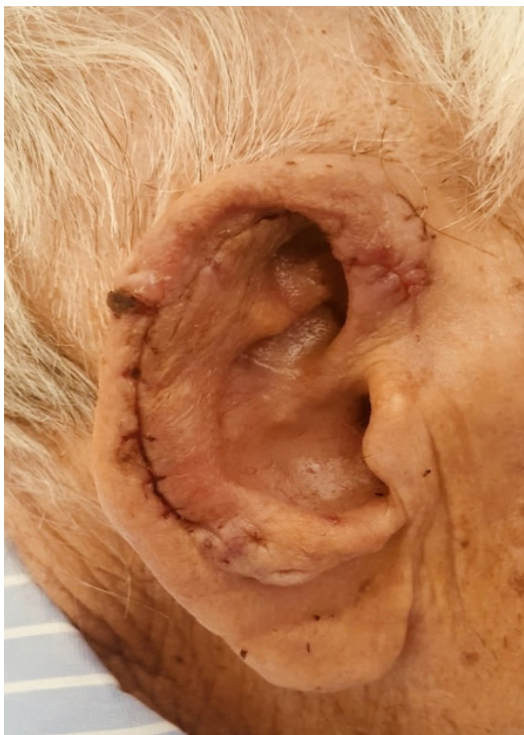
Figura 7. Resultado tras retirada de puntos.

La reconstrucción del pabellón, en caso de pérdida de sustancia, ya sea postraumática o posquirúrgica, plantea un problema complejo al cirujano, que debe esforzarse en restituir lo mejor posible las características de esta estructura, de forma que se obtenga una oreja de aspecto natural [3, 4].