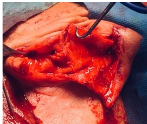
Figura 5. Despegamiento de colgajo hasta surco retroauricular con triángulo de Burrow.