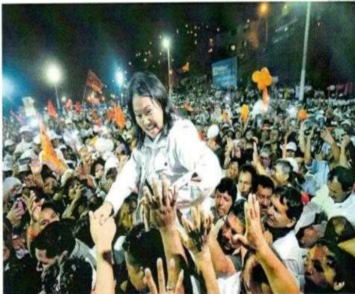
■ SEGUNDA VUELTA. No tuvo mucho descanso y 48 horas después de las elecciones, la candidata de FP retomó la campaña.

También respondió a los cuestionamientos de la pare-