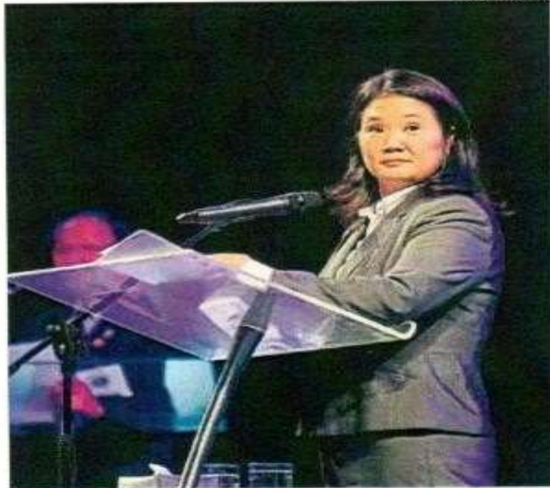
■ CAMBIA DE DISCURSO. En Harvard, respaldó la unión civil.

De otro lado, la lideresa de Fuerza Popular negó que la pugna pública con su hermano Kenji haya debilitado su candidatura y dijo que, por el contrario, fue la oportunidad para marcar la posición institucional de que todos deben respetar las normas internas y