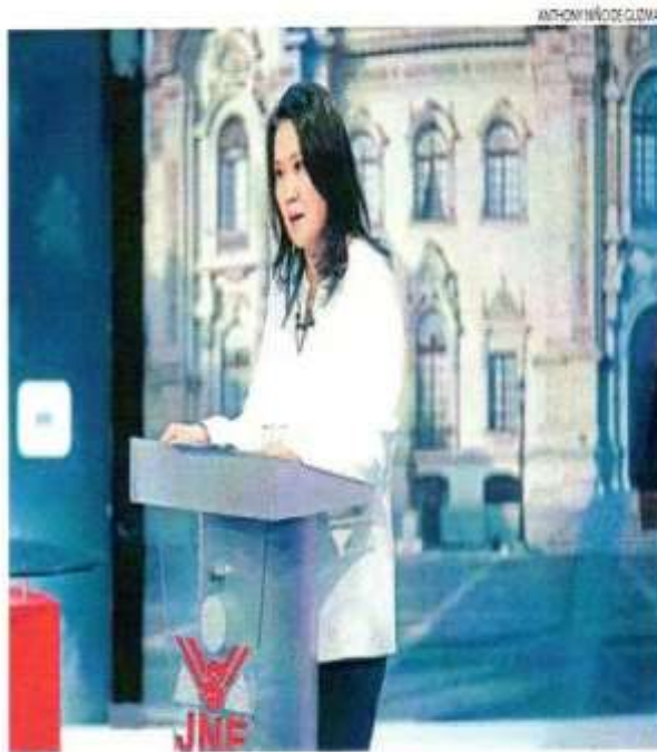
■ SEMANA DECISIVA. Keiko Fujimori resaltó que los debates sirvieron al elector para decidir su voto.

"Lo que debemos buscar es que un suceso de esa naturaleza ('Baguazo') nunca más vuelva a ocurrir", manifestó Fujimori durante un mitin que encabezó en la referida ciudad, en la última semana de la campaña electoral.