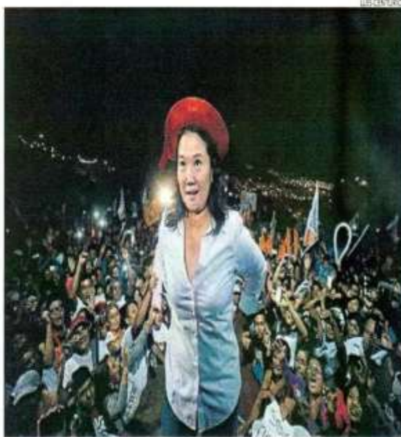
■ EN SU RUMBO. Candidata Fujimori hizo un llamado para que funcionarios mantengan su neutralidad.

Fujimori indicó que este sector debe tener la misma oportunidad que los maestros, que pueden trabajar en un colegio privado y uno pú-