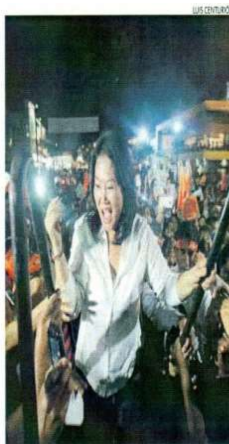
■ QUE VENGA. Pidió a Kuczynski recorrer el país antes que EE.UU.

"Eso nos compromete más para que, en caso de ser elegidos, a partir de nuestra ejecutoria, ya no tengan esas dudas, porque si repitiésemos los errores del pasado, supuesto