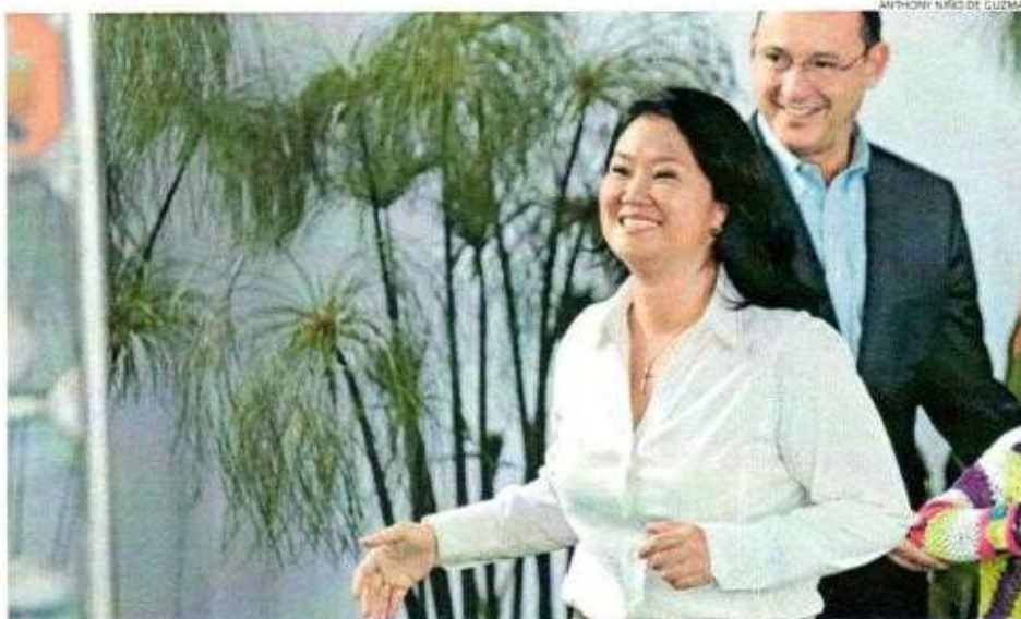
■ CAMBIO DE PLANES. Fuerza Popular busca ahora que la polémica con PPK se realice en el norte del país.