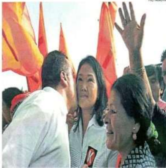
■ BUSCA CONFIANZA. La líderesa de Fuerza Popular intenta desmarcarse del gobierno de su padre.

Luego mencionó: “Soy una persona que, en los años que lleva en política, ha sido respetuosa del orden democrático. Jamás he dado una señal de autoritarismo. Lo que sí existirá es el principio de autoridad,