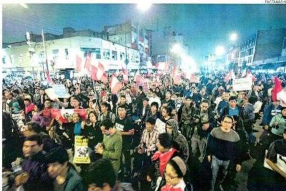
■ MULTITUDINARIO. Manifestantes portaron banderolas con consignas antifujimoristas y terminaron su marcha en la plaza Dos de Mayo.

'SERÍA ANTIDEMOCRÁTICO DE MI PARTE DECIR QUE ELLA NO DEBE PARTICIPAR', DUO