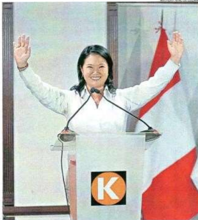
■ PRIMER ROUND. Al 40% de reportes de la ONPE, Fujimori alcanza el 39.18%. Falta la segunda vuelta.

"Vamos a seguir trabajando hacia el futuro. Tengo un compromiso de honor con mi país. Esperamos que la segunda vuelta sea con propuestas, que sea alturado", precisó.