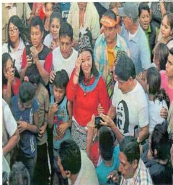
■ FUA SU TERRITORIO. Candidata presidencial sostuvo que mensaje a su hermano fue claro y directo.

Esta postura obligó a la lidereza a emitir un pronunciamiento público acompañada del Comité Ejecutivo Nacional