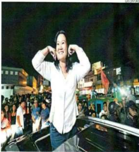
■ CAMPAÑA EN EL NORTE. Candidata prometió obras de agua potable para la región cajamarquina.

"Y luego, cuando ocupó el sillón presidencial, se olvidó de sus convicciones, se olvidó