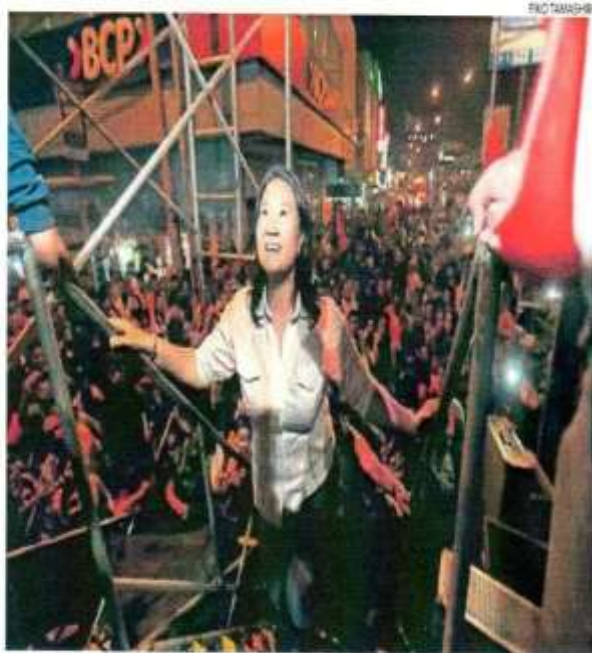
EN AGENDA. Candidata indicó que hay más de 400,000 personas que necesitan atención.

"Fueron muy pocas las personas que lograron su formalización. Y de los que no pudieron, muchos son perseguidos y otros investigados. Esto no les permite comprar la herramienta más importante que es la dinamita. Eso es lo que ocurre cuando se hacen normas desde el escritorio", manifestó Fujimori en conferencia de prensa desde el local de su partido, en La Molina.