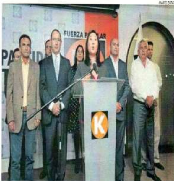
■ EN SU SITIO. Keiko Fujimori zanjó públicamente con su hermano y dejó sin piso sus pretensiones.

"Fuerza Popular ratifica su indeclinable compromiso ante el sistema democrático y rechaza cualquier intento de alterar procesos de elección interna con la autoproducción de una candidatura a cinco años de una elección", afirmó.