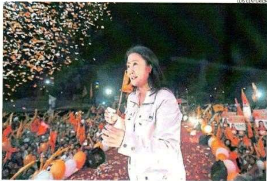
■ RETOMA CAMPAÑA. Fujimori encabezó anoche dos mítines. Uno en Ate y otro en Jicamarca.

“Ellos (PPK), tal y como lo señala la página 134 (en la que se aborda el tema de la compensación por tiempo de servicios), tienen propuestas para las grandes empresas, mientras que nosotros priorizamos