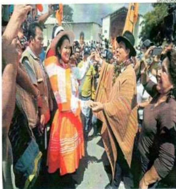
■ POR EL SUR DEL PAÍS. Candidata Keiko Fujimori continúa hoy su gira por diversas localidades.

“Ayer, efectivamente, teníamos planificado visitar el Vraem, la idea era salir en un helicóptero. Lamentablemente la empresa que iba a darnos el servicio le pidió los servicios al Ejército para que se nos pudiera prestar la gasolina, que luego iba a ser devuelta, debido a las restricciones que hay en el Vraem, ya que es zona declarada en emergencia. Quiero señalar que a Fuerza Popular se le negó este pedido cuando