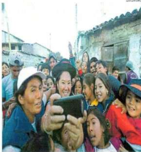
■ EN CAMPAÑA. Candidata de Fuerza Popular llegó a Andahuaylas, donde prometió diversas obras.

"Si queremos buscar una verdadera reconciliación, si hay algunas personas que están arrepentidas (ex terroristas) y que buscan dialogar con las instituciones y con el Estado,