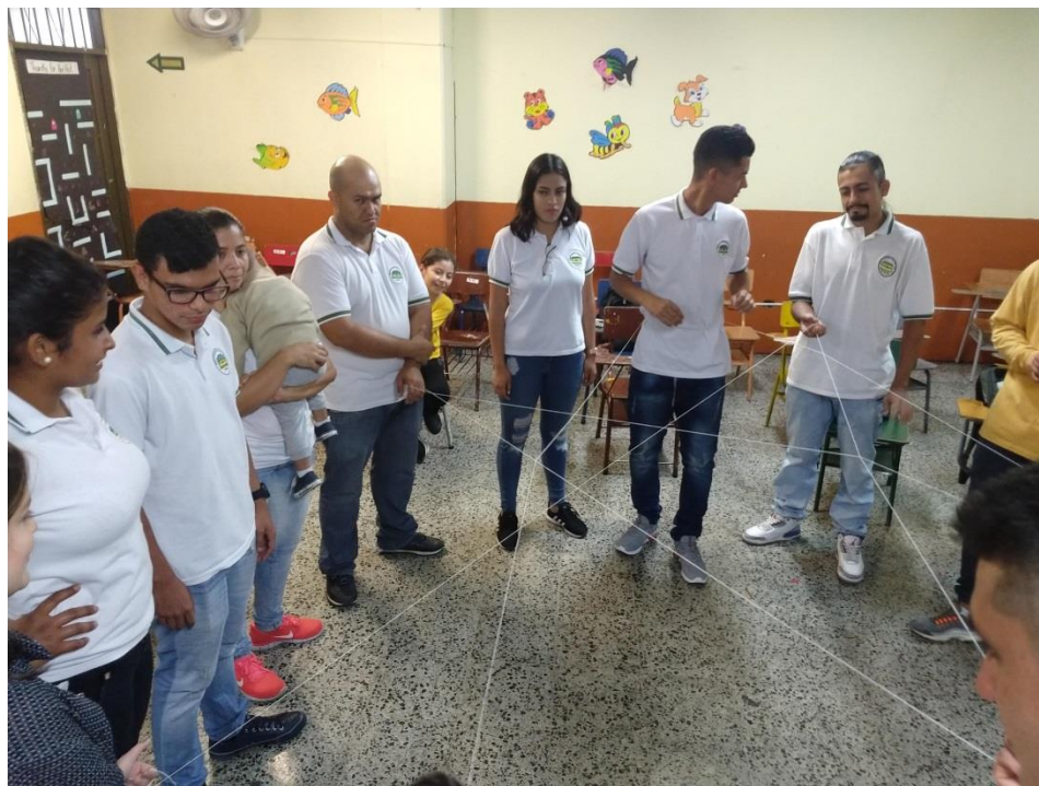
Anexo 1. El poder, grado undécimo 20/08/2019