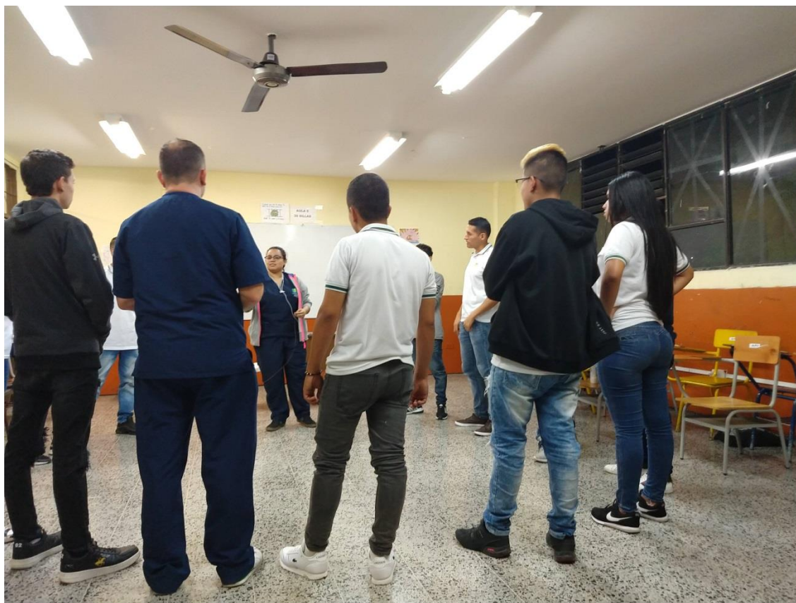
Anexo 3. Proyecto de vida, grados sexto y séptimo 25/09/2019