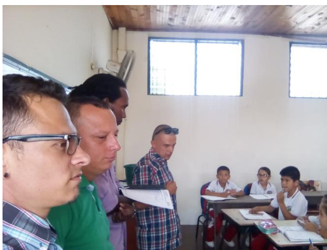
Ilustración 4 - Formato de Inscripción