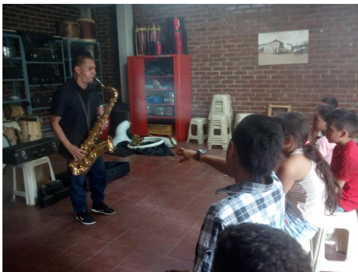
Ilustración 8 - Presentación de instrumentos

De acuerdo a las instrucciones de la Secretaría de Cultura y Deporte, se debía tener prioridad en las siguientes instituciones educativas para esta convocatoria; escuela Manuelita Sáenz, Institución Educativa General Santander, Institucion Educativa Alfonso López Pumarejo, Liceo Gabriela Mistral, Institución Educativa Bernardo Arias Trujillo, Institución Educativa