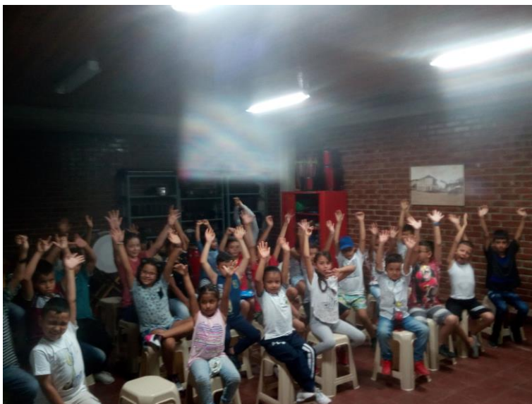
Ilustración 10 – Grupo de niños

Se contó con un total de 64 niños inscritos para 36 cupos disponibles para conformar la banda, no se tuvo que excluir a ninguno de los niños pues varios de los inscritos no fueron nunca y otros fueron a las primeras dos clases y no volvieron así que poco a poco fueron quedando los niños realmente interesados y que cumplieron con las normas básicas para estar en la banda.