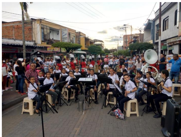
Ilustración 13 – Grupo musical conformado

El día viernes 8 de noviembre se llevó a cabo en el teatro municipal Hernando López Yepes , el concierto de clausura para la comunidad en general pero en especial para las familias de los niños y niñas integrantes de la banda.