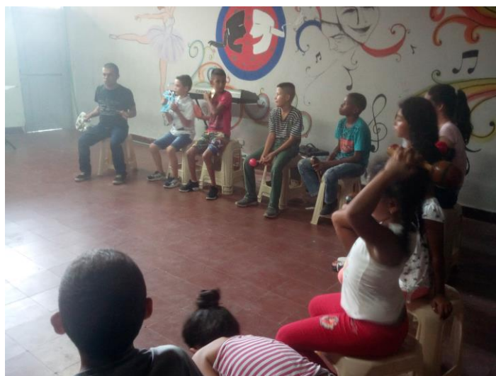
Ilustración 5 – Registro fotográfico “Niños en clase”