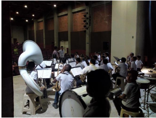
Ilustración 14 – Socialización a padres de familia

En este se interpretaron las 5 obras que se trabajaron con los niños y niñas.