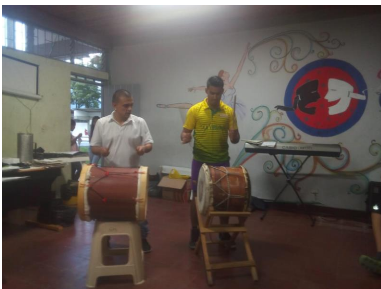
Ilustración 12 – Entrenamiento rítmico

Ya todo depende de la creatividad del maestro para jugar de todas las maneras posibles con ellos.