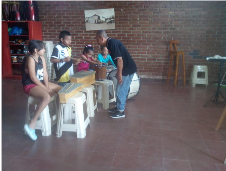
Ilustración 6 - Implementación de metodología (Orff)