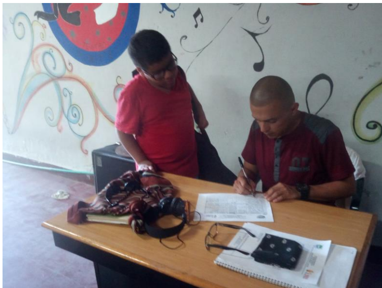
Ilustración 9 – Proceso de inscripción

En el momento de las inscripciones, también se acercaron niños de las instituciones Pedro Pablo Bello y Nuestra Señora de La Presentación, en las cuales no se realizó la convocatoria por instrucciones de las directivas de La Casa de la Cultura; sin embargo estos niños hicieron parte del proceso ya que la convocatoria fue a nivel municipal y por ser un programa que hace parte del plan de gobierno de la administración local, la invitación se hizo extensiva tanto para niños escolarizados y no escolarizados.