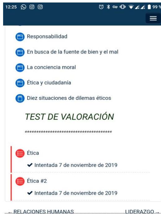
Ilustración 12: Evidencia, Estudiante 6