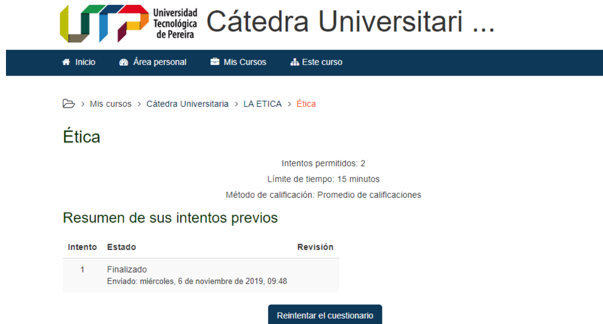
Ilustración 4: Evidencia 1, Estudiante 2