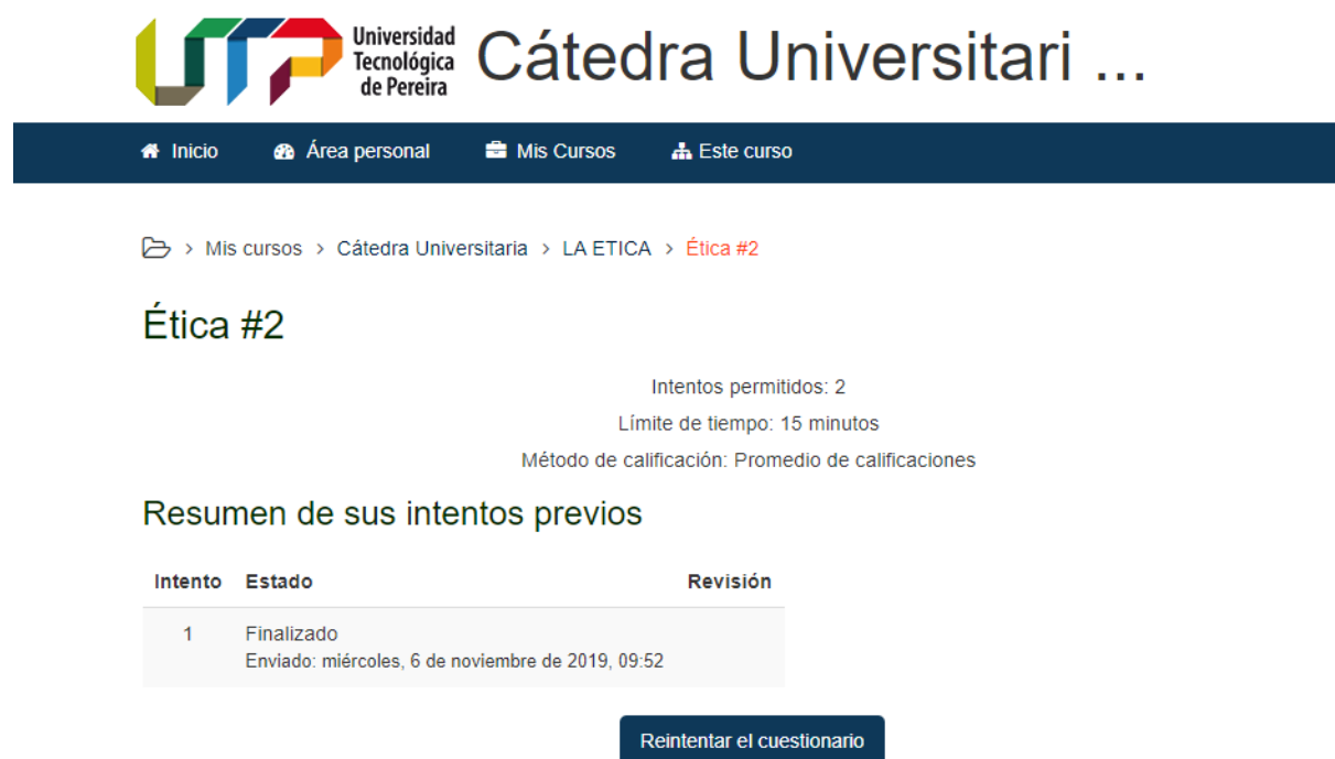
Ilustración 5: Evidencia 2, Estudiante 2