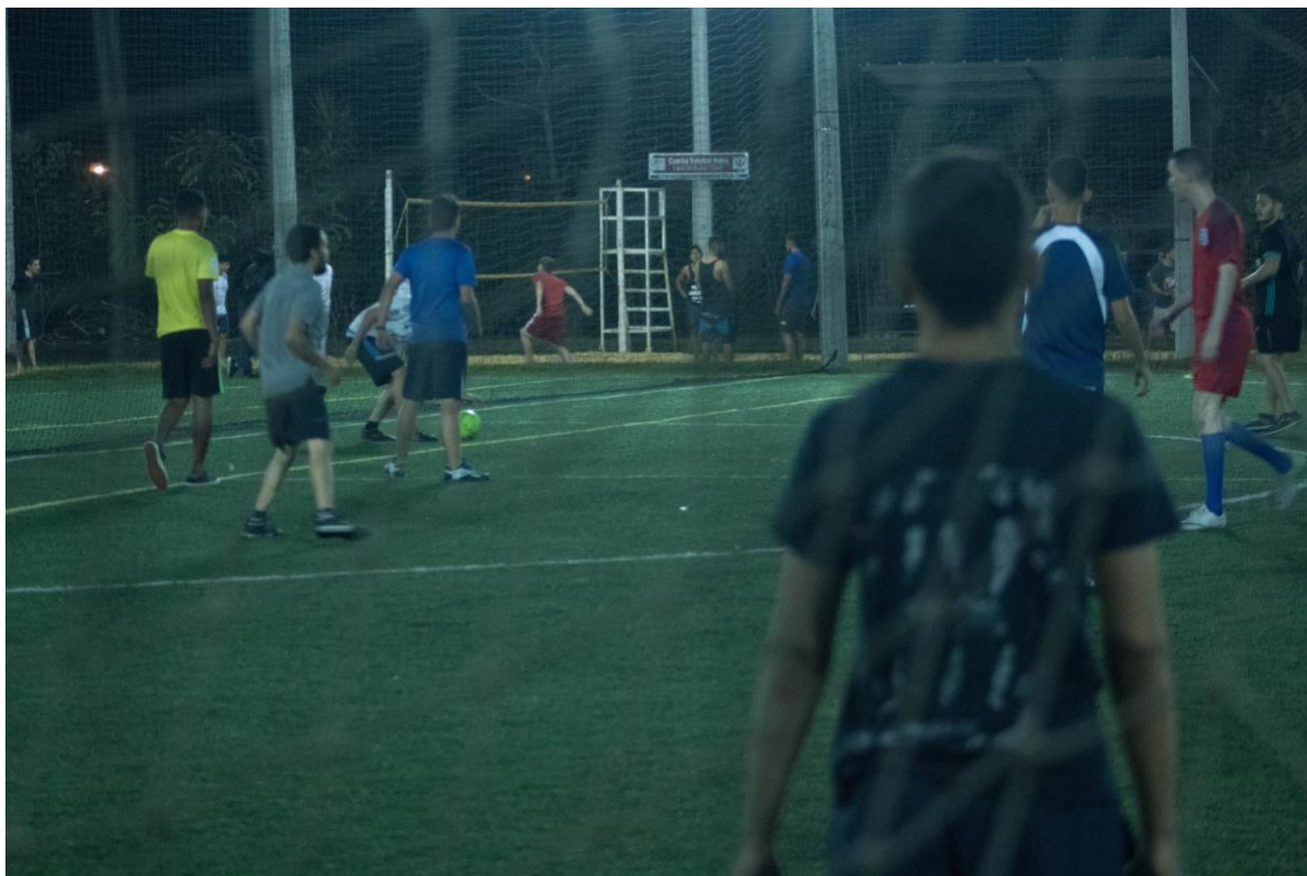
Anexo: Actividad deportiva.