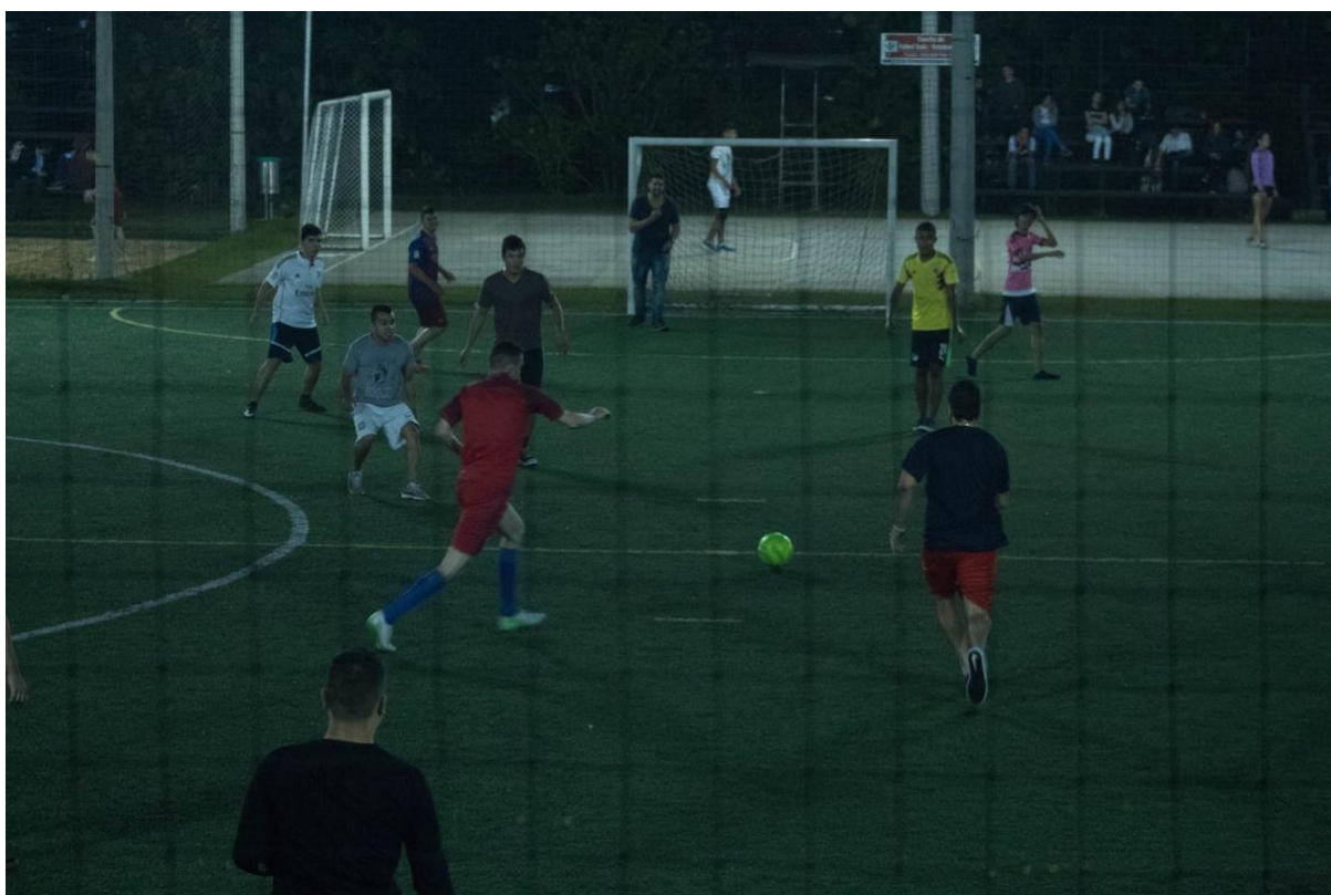
Anexo: Actividad deportiva.