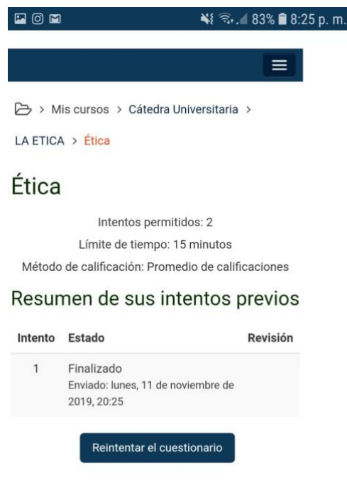
Ilustración 13: Evidencia 1, Estudiante 7