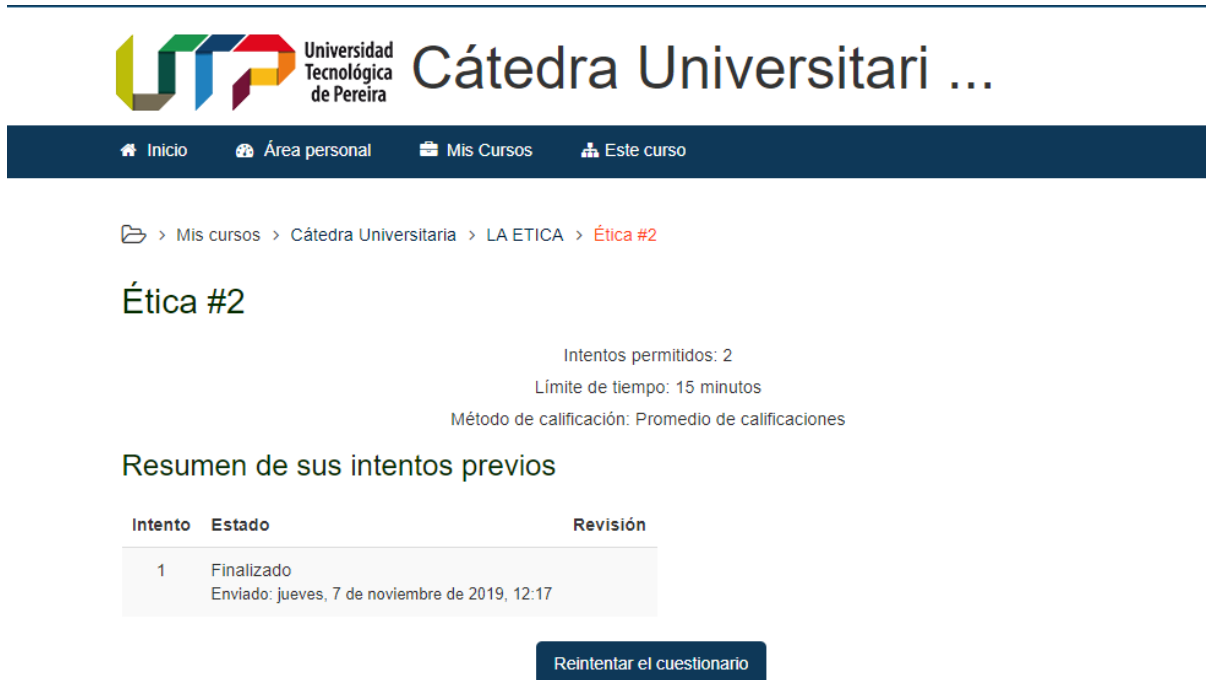
Ilustración 11: Evidencia 2, Estudiante 5