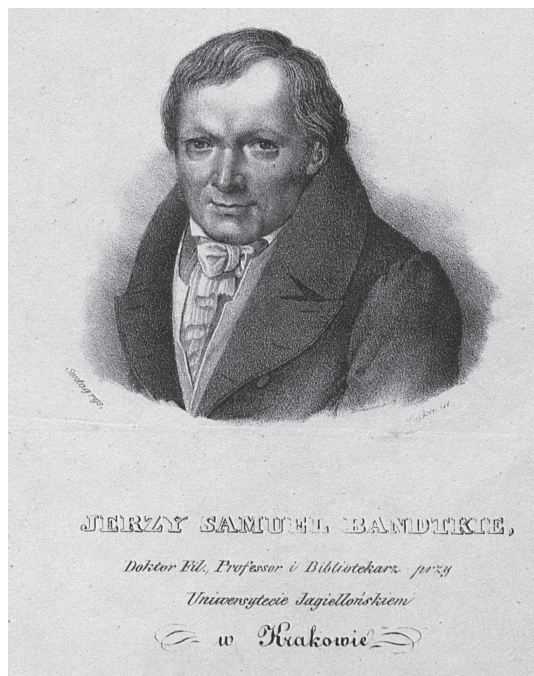
Fig. 2. Jerzy Samuel Bandtkie (1768–1835), librarian in the Jagiellonian Library, author of publications of many finds of Roman coins from the Kraków region.

Cataloguing ancient coin finds, including Roman coins, was also among the main research tasks of the Department of Numismatics, established in 1969 within the JU Chair of Oriental Studies, and renamed in 1972 as the Laboratory of Oriental Sources and Numismatics of the