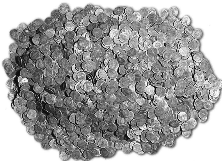
Fig. 8. Hoard of 3170 Roman denarii found at Nietulisko Małe discovered in 1939; rediscovered in 1995.

available for broad circles of researchers at the following address: https://coindb-prod.ocean.icm.edu.pl/AFE_PL/