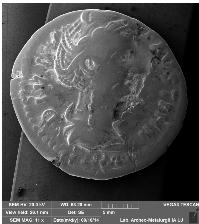
Fig. 9. Examination of chemical composition using EDS method – example of the denarius of Faustina the Elder (148–161 AD).

evidence of cultural and social transformations which took place in the territory of present-day Poland in antiquity. The issue in question features in books and papers published by the Institute staff and is addressed in conferences held at international and national levels, and the results are regularly presented during the meetings of the Numismatic Section of the Archaeological Commission (PAS, Kraków branch) and recapitulated during the annual conference held at the Institute of Archaeology. An important aspect of the research is the cooperation among the JU Institute of Archaeology and other archaeological institutions and units in Kraków: the Institute of Archaeology and Ethnology PAS, the Numismatic Section of the Archaeological Commission (PAS, Kraków branch), and the Archaeological Museum in Kraków, as well as with other, non-archaeological academic units. Furthermore, this cooperation with respect to studies on the inflow of Roman coins to Barbaricum is not limited to the archaeological circles in Kraków. For several years, the archaeologists from JU have been cooperating in this respect with the Institute of Archaeology of the University of Warsaw, and, through participation in national and international research projects, with other archaeological centres in Poland and abroad as well.