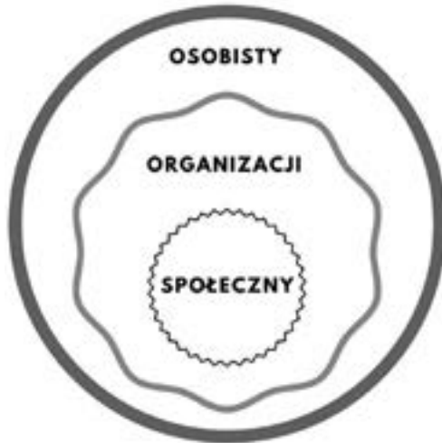
Rysunek 2. Poziomy transgresji w turkusowym modelu organizacyjnym

które nieraz wymagają wyjścia poza oswojone schematy działania. Transgresja zwykle odbywa się na trzech poziomach: poziomie indywidualnym, organizacji oraz społecznym, gdzie każdy kolejny zawiera się w poprzednim (rysunek 2).