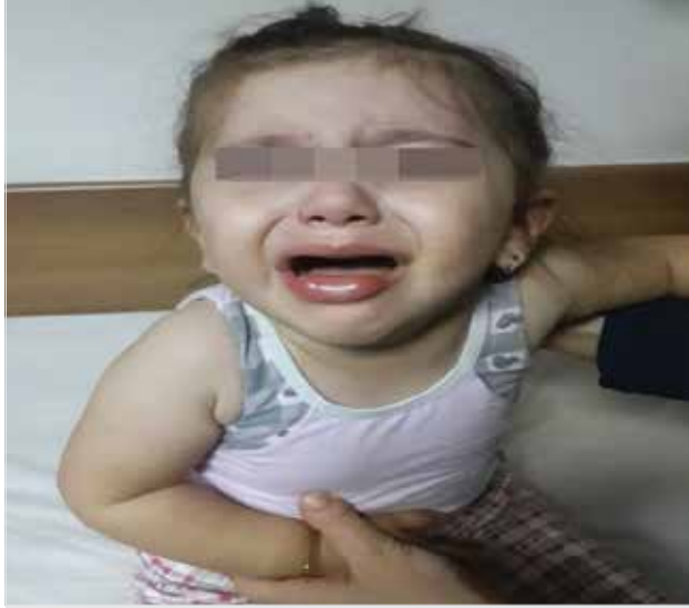
Resim 1. Oral demir (II) glisin sülfat kompleksi (Ferrosanol®) şurup kullanımı sonrası kız çocuğunun dudaklarında gelişen anjiyoödem

2 ay 20 günlük prematüre olarak doğan erkek olgu DEA profilaksisi amacıyla demir (III) hidroksit polimaltoz kompleksi içeren (Vegaferon®) damla kullanımını takiben karnında eritem ve yer yer ürtikeriyal döküntü nedeniyle getirildi. Daha önce Devit3 damla dışında ilaç kullanım öyküsü ve allerji öyküsü yoktu. Hastanın negatif saptanan deri testleri sonrasında gözlem altında aynı demir preparatını tekrarlayan kullanımlarında tüm vücutta yaygın ürtikeriyal plaklar görülmesi üzerine preparat değiştirildi. Artan dozlarda demir (II) glisin sülfat kompleksi (Ferrosanol®) damla verilmesine geçildi. Takibinde herhangi bir allerjik reaksiyon görülmedi (Resim 2). Bu çalışmaya katılan hastanın ailesinden sözlü onam alınmıştır.