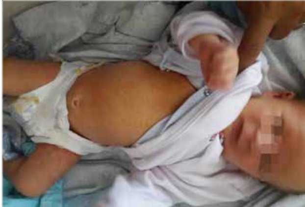
Resim 2. Demir (III) hidroksit polimaltoz kompleksi (Vegaferon®) damla kullanımı sonrasında gelişen ciltte eritematöz döküntü