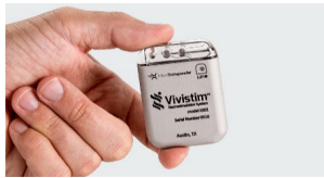
Figura 1. Componentes principales del sistema Vivistim®