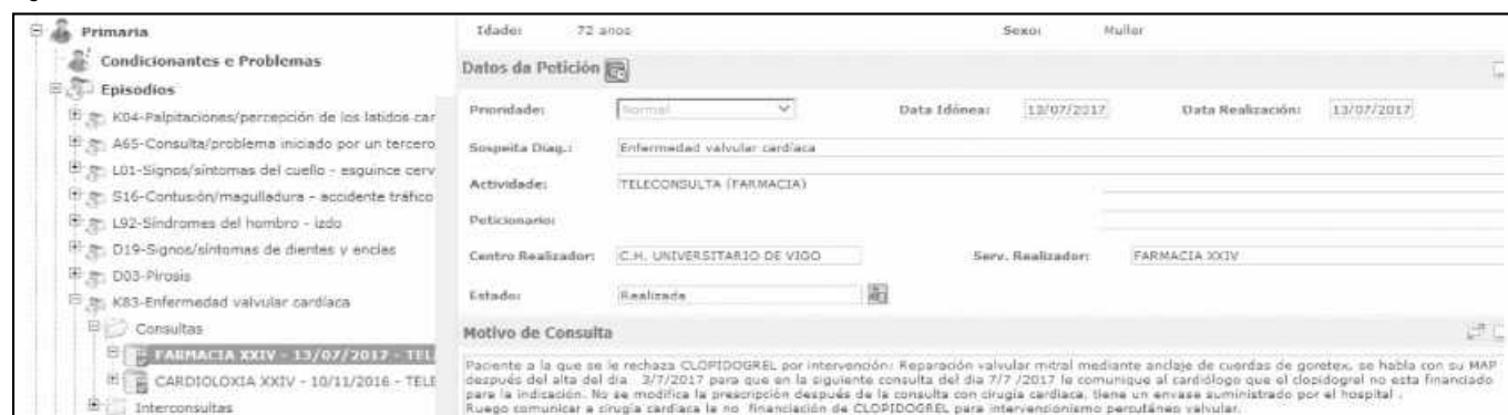
Parte 1. Ejemplo de teleconsulta (integrada en la historia electrónica del paciente) realizada por un médico de Atención Primaria a Farmacia de Hospital: Motivo de consulta.