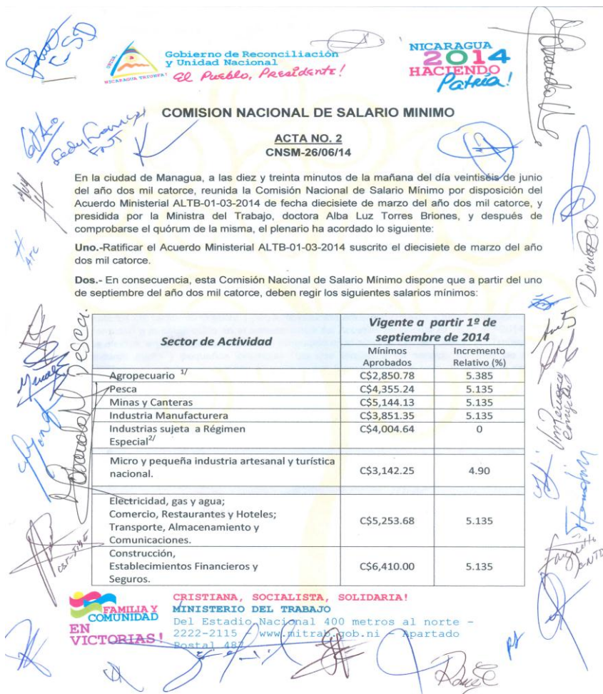
Tabla salarial República de Nicaragua