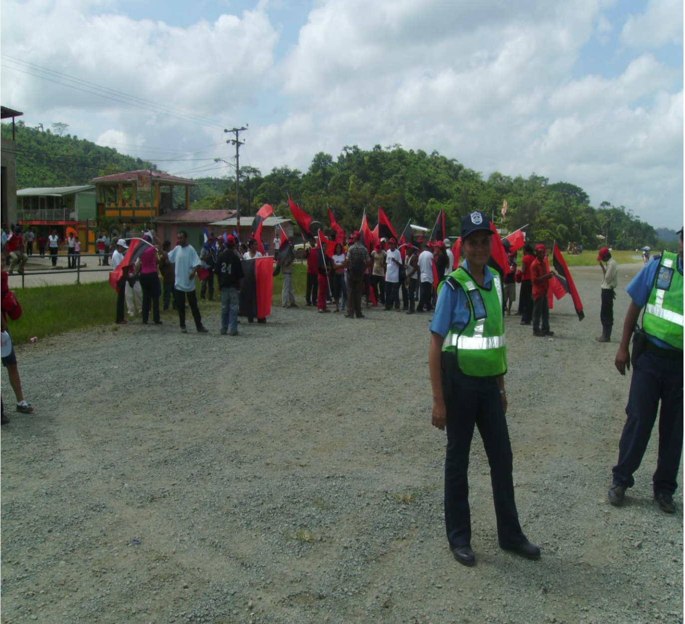
Foto 2: Mujer policía ejerciendo labor de patrullaje, en la pista de aterrizaje en fecha 19 de Julio/08.

Mujer policía en la comunidad de las quebradas, capacitando a policías voluntarios, en fecha 15-06-08