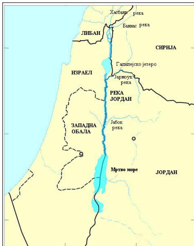
Слика 1 – Слив реке Јордан

У овој области сусрећу се две рељефне целине, и то област планинских предела на северу басена и великих низија на југу. Низија се једним делом налази у највећој криптодепресији на свету, чије најниже тачке се спуштају и преко 400 m испод површине мора.