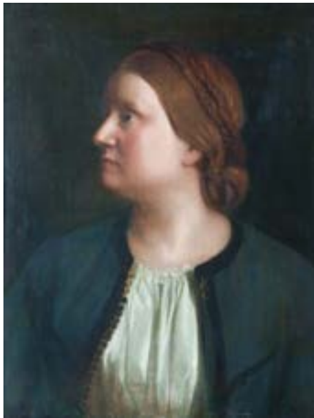
Fig. 1: Samuel Laurence, Barbara Leigh Smith Bodichon (ca. 1861), The Mistress and Fellows , Girton College, Cambridge.

De hecho, como ella misma confesó a una de sus amigas, se sentía mejor entre personas no convencionales: