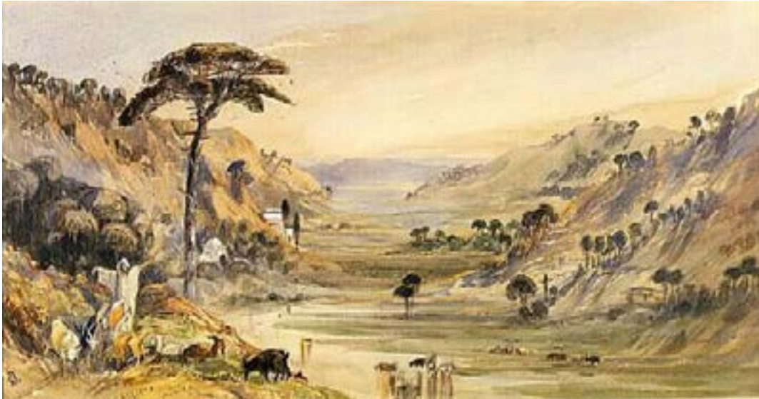
Fig. 3: Barbara Leigh Smith Bodichon, Landscape near Algiers (1850-60). Acuarela, 21,8 x 41,5 cm. Victoria & Albert Museum, Londres