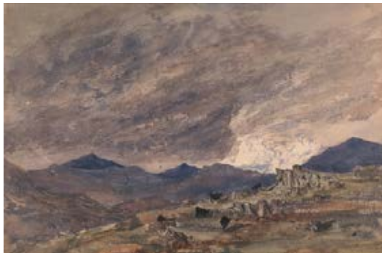
Fig. 2: Barbara Leigh Smith Bodichon, View of Snowdon with a Stormy Sky (ca. 1854). Acuarela, 22,5 x 34,3 cm. Yale Center for British Art, New Haven. Paul Mellon Fund.

Landscape was her forte; human figures were rarely granted more than a token role in pictures dominated by hills, trees, coasts, mountains, clouds, ruins, sunsets and moving water. [...] Bodichon's work has also been linked to that of her friends of the Pre-raphaelite Brotherhood, which it could sometimes resemble with a suggestion of a leafy or rocky detail (Crabbe, 284-285).