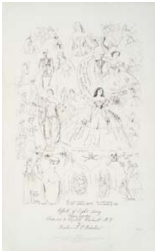
Fig. 5: Barbara Leigh Smith Bodichon, The Effects of Tight Lacing (c. 1858). Litografía off-set, 51 × 31.8 cm. Delaware Art Museum, Wilmington. Fondo adquirido en 2017.

Una de las grandes preocupaciones de Bodichon era la educación de las mujeres, a la que dedicó un gran esfuerzo y también mucho de su dinero. Se le conoce en este ámbito fundamentalmente por la fundación, junto a Emily Danes, de Girton College en 1869, la primera institución inglesa en la que las mujeres podían obtener la misma educación superior que los hombres en la universidad. También lideró y participó en varias campañas para denunciar la desigualdad legal entre hombres y mujeres, como la que impedía a las mujeres mantener sus posesiones económicas si dejaban de convivir con sus maridos. En este sentido, cabe reseñar otra faceta destacada de Bodichon, la de escritora. Sus escritos se centraron en sus causas como activista, con panfletos políticos y artículos en periódicos. Además, en 1858 fundó una revista dedicada a temas de interés para las mujeres, English Woman's Journal , cuya sede londinense en Langham Place se convirtió en lugar de reunión de mujeres con intereses similares a los suyos, y de ahí surgieron importantes asociaciones para la promoción del empleo de la mujer y para debatir sobre el derecho de la mujer al sufragio (Frederick, 2018: s.p.).