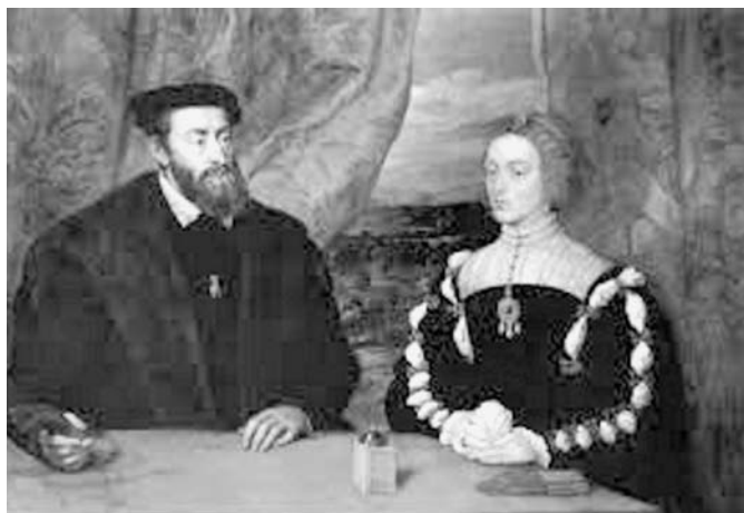
Fig. n.º 6.- Carlos V e Isabel de Portugal . Copia de Rubens de un original perdido de Tiziano.

«Además del natural deseo de dejar descendencia [...] muchas y muy graves razones nos han llevado a unirnos en estable y justo matrimonio con doña Isabel [...] Pero sobre ser de tal calidad las dotes y virtudes de su ánimo, que tanto han cautivado el nuestro, viénense a juntar el consentimiento unánime del pueblo español, quien, con frecuencia ruegos y peticiones, nos impulsa que optemos por dicha esposa porque ve ciertamente que ninguna en estos tiempos es más apta para nuestras nupcias,