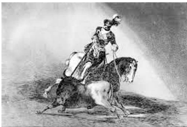
Fig. n.º 11.- Carlos V lanceando un toro en Valladolid en las fiestas celebradas por el nacimiento de su hijo Felipe II. Aguafuerte de Francisco de Goya. 1815-1816.

En el festejo taurino en homenaje a Carlos e Isabel se corrieron doce toros que costaron 43.250 maravedíes, cantidad que subió a poco más de 50.000 por otros gastos. No se contabilizan en estas cifras los gastos de los acompañamientos musicales y adorno de la plaza. Así se pormenorizaron: