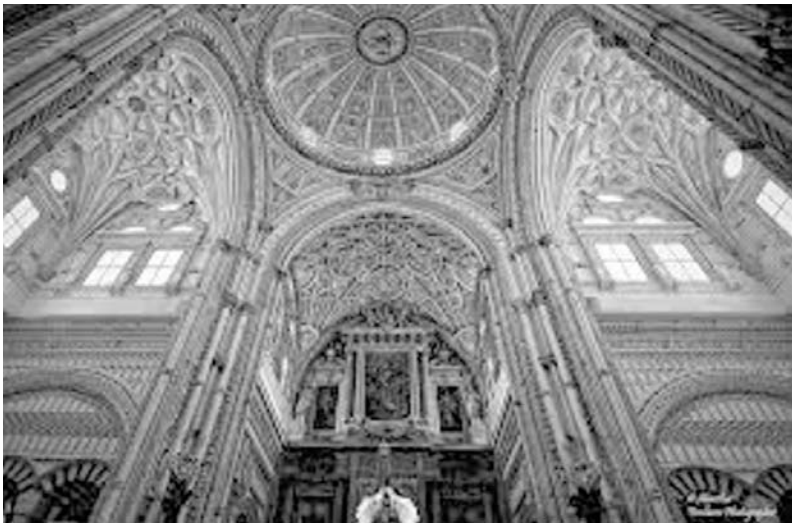
Fig. n.º 10 .- Crucero catedralicio de Córdoba.

¿Fueron ciertas estas palabras? No hay testimonio documental de ellas. En una obra de Juan Gómez Bravo escrita en el siglo XVIII se citan literalmente pero sin precisar el autor la fuente de información que tuvo. Parece ser que utilizó una carta