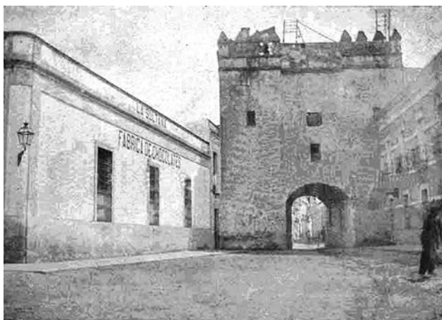
Fig. n.º 8. La Puerta de Osario (Córdoba) a principios del siglo XX, poco antes de su demolición. Por ella entraron Carlos V e Isabel en Córdoba el 20 de mayo de 1526.

La entrada real y la presencia de Carlos e Isabel en Córdoba están poco documentadas. La fuente más importante para conocer sus pormenores es el libro de gastos elaborado para la ocasión que tiene abundantes datos aunque incompletos. A través de ellos se puede concluir que el programa no varió mucho de los que se produjeron en Écija y Granada: recibimiento civil, discursos de bienvenida, desfile procesional, reci-