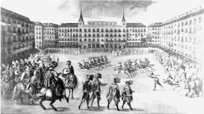
Fig. nº. 12 .- Juegos de cañas en Madrid (siglo XVI) .