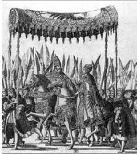
Fig. n.º 9.- Carlos V y el papa Clemente VII en la coronación imperial celebrada en Bolonia el 22 de febrero de 1530. Bajo un palio similar entraron Carlos e Isabel en Córdoba el 20 de mayo de 1526.