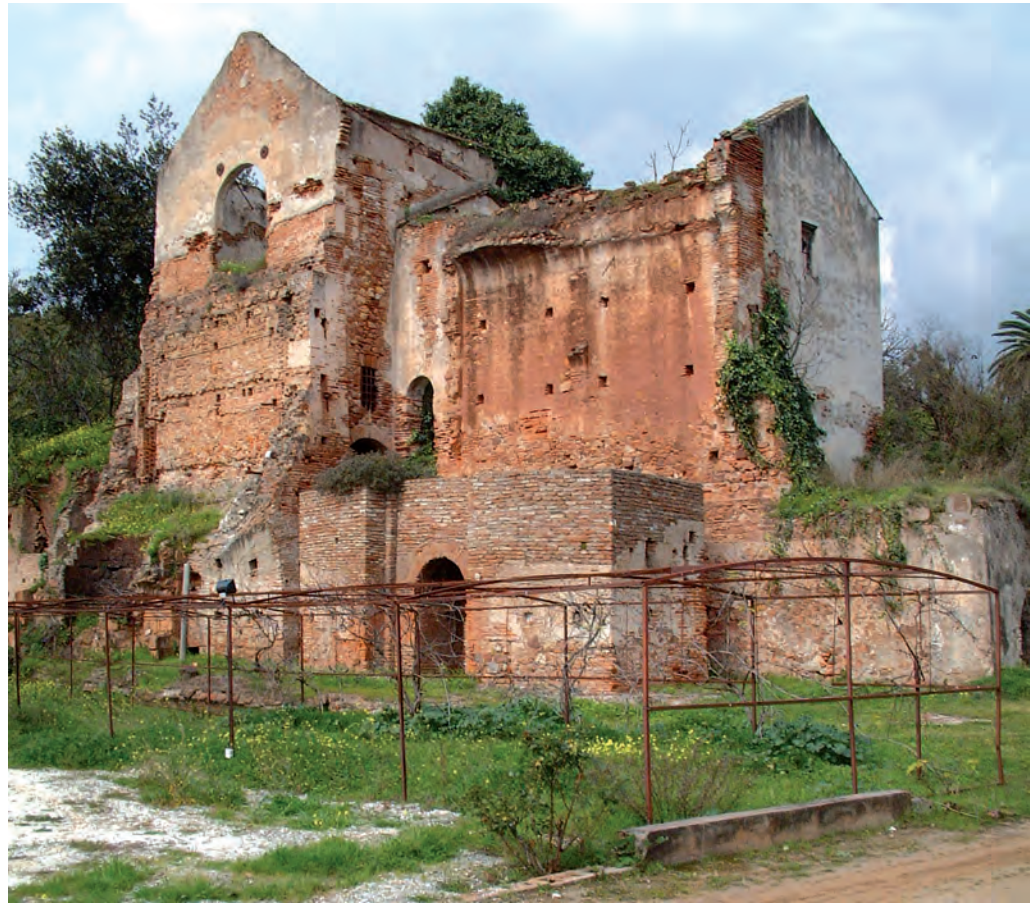
Figura 3. Estado actual.