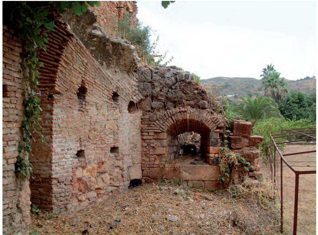
Figura 4. Estado actual.