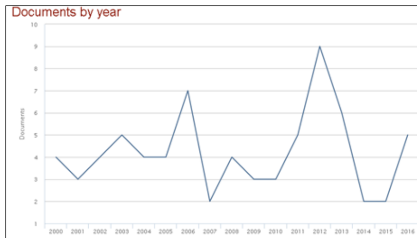
Figura 2. Documentos por año publicados en el periodo 2000-2016 con filiación de la FCA-UNLZ.

Se observa una importante oscilación en la tasa anual de publicaciones, entre 2 y 9 documentos por año (Figura 2). Considerando los 5 años del periodo 2012-2016 la cantidad de publicaciones totaliza 24, arrojando un promedio general de 4,8 documentos por año para toda la institución. Estos datos muestran que en la FCA-UNLZ es posible publicar 7-9 papers por año con la cantidad de grupos de investigación disponibles en la institución. Además, plantean el desafío de publicar una mayor cantidad de papers por año en forma sostenida en el tiempo.