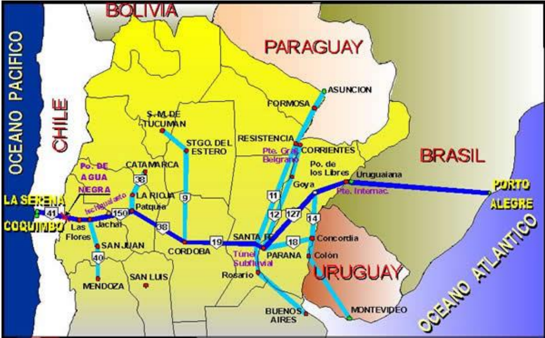
Figura 1: Corredor Bioceánico Porto Alegre- Santa Fé – Coquimbo

El siguiente mapa elaborado por la Fundación Nuestro Mar marca la ruta troncal del corredor: