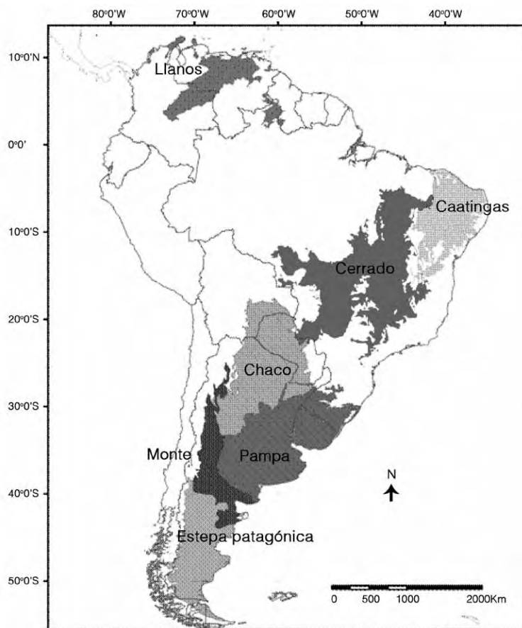
Figura 1: Distribución de las regiones de pastizales, montes y sabanas que se usan para pastoreo extensivo, es decir la forma tradicional de producción animal, en Sudamérica. Se muestran las distintas regiones de Sudamérica ocupadas por ecosistemas de climas áridos hasta subhúmedos en las que el pastoreo es una de las principales actividades productivas. Reproducido con permiso de Yahdjian y Sala (2008).

mayor productividad, con precipitaciones anuales cercanas a 1500mm.