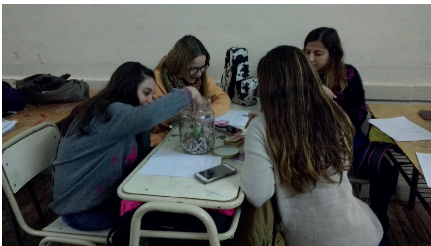
Figura 4. Estudiantes de la Tecnicatura Superior en Bibliotecología explorando las minivitrinas.

“Los pin y pon, cuando era niña había distintos tipos, con diferentes oficios y ocupaciones, con sus accesorios. Podía pasar horas jugando y creando historias” (Estudiantes 8, Tecnicatura Superior en Bibliotecología).