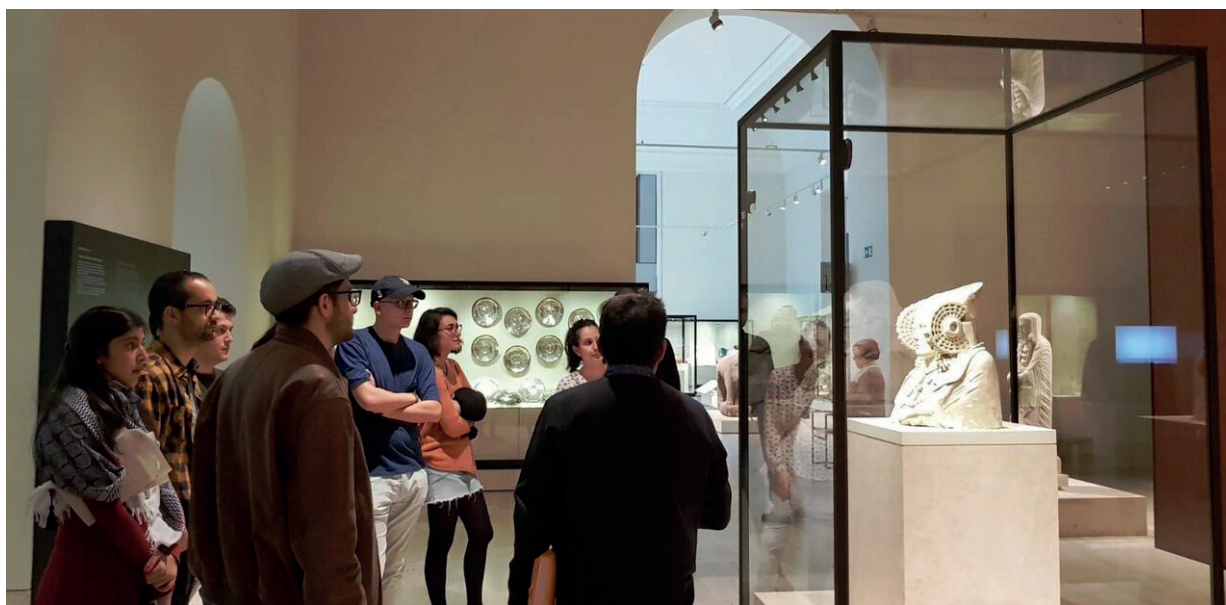
Figura 2. Estudiantes de Magisterio frente a la Dama de Elche

qué estás tan callada?...” Los estudiantes universitarios desean conocer sus sentimientos y emociones: “¿Qué representan tus joyas? ¿Qué piensas? ¿Te sientes sola cuando el museo cierra?, ¿Dónde miras?, ¿Eres feliz?, ¿Por qué te hicieron un retrato en piedra? ¿Si pudieras hablar que nos dirías de tu pueblo? ¿Eras una sacerdotisa, una diosa, una vestal sacrificada? Con tantas joyas... ¿harías mucho ruido al moverte, no?” etc... Todo confluye en la reconstrucción fabulada de su verdadera historia que deberán poner por escrito al regresar a las aulas.