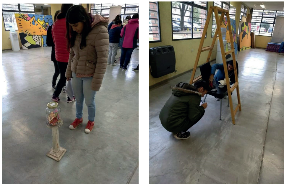
Figura 5. Estudiantes del Profesorado de Educación Inicial. Explorando minivitrinas.