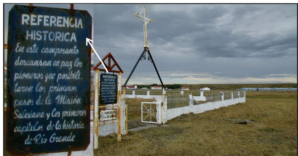
Figura 2. Entrada del cementerio de la Misión.

La puesta en valor del cementerio según esta iniciativa aún no ha sido aplicada, con lo cual este trabajo no presentará resultados en términos de valoraciones de los distintos grupos de interés. En estos momentos, lo que se está llevando a cabo junto a la comunidad selknam es el regreso a la provincia de Tierra del Fuego de los restos que fueron exhumados del cementerio de la Misión, y el acompañamiento en su posterior restitución a la comunidad. Esto constituye ahora el principal interés por parte de la comunidad: lograr la restitución y llevar a cabo la depositación final de los restos. La puesta en valor del cementerio aún no es parte de su agenda, por ello no se ha comenzado a trabajar en dicha etapa.