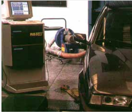
Figura 3. Servicios de Inspección de Emisiones. Laboratorio de Control de Calidad V&C