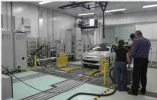
Figura 4. Inauguración del LCEGV

De esta asociación surgió un beneficio directo para el país que no contaba con un servicio de certificación de emisiones vehiculares. Esto requería su utilización en el extranjero (Brasil) adonde debían enviarse prototipos y muestras representativas de la producción de cada terminal para homologar los nuevos modelos a producir y controlar el funcionamiento de las líneas de ensamblado de las terminales automotrices argentinas (control de producción).