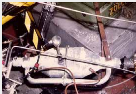
Figura 2. Pruebas en Banco de Motor de YPF