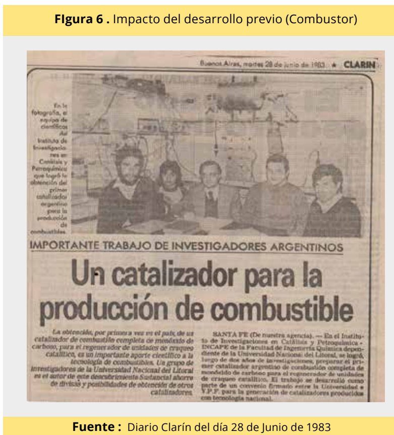
Figura 6 . Impacto del desarrollo previo (Combustor)