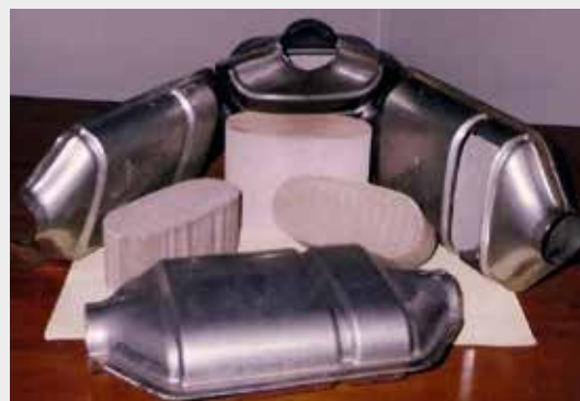
Figura 1. Catalizadores de "Tres Vías"

Se obtuvieron prototipos (Fig. 1) cuya performance en funcionamiento (Figs. 2 y 3) era por lo menos similar (4) a la de los ofrecidos en el mercado internacional, lo que aseguraba que el producto desarrollado respondía a las normativas vigentes y expectativas del mercado. Por otra parte se disponía no solo de los métodos de preparación en laboratorio sino también de un pre-proyecto para la construcción de una planta productora de 120.000 dispositivos catalíticos por año que permitía la proyección de los métodos productivos y un análisis económico preliminar.