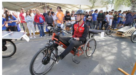
Figura 6: Instantánea de SUR18