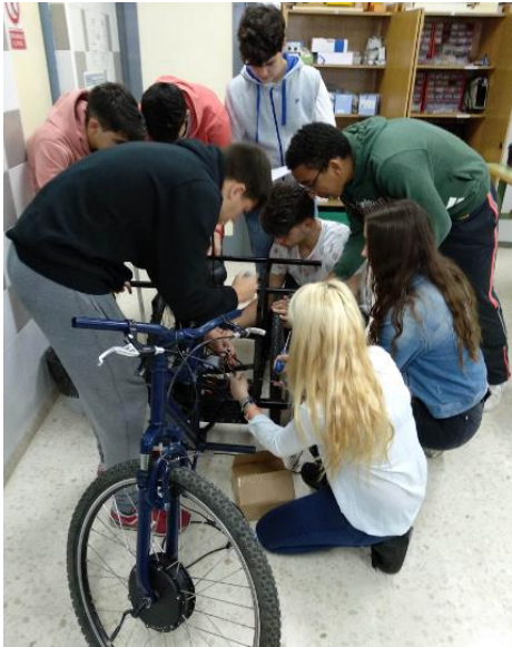
Figura 2: Estudiantes trabajando en la construcción de un prototipo

aprenden que lo estudiado en clase sirve realmente en la vida real. La Figura 2 muestra una instantánea de un grupo de estudiantes trabajando en un prototipo.