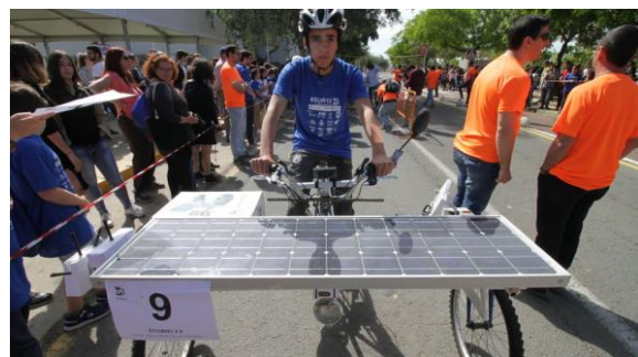
Figura 7: Instantánea de SUR18