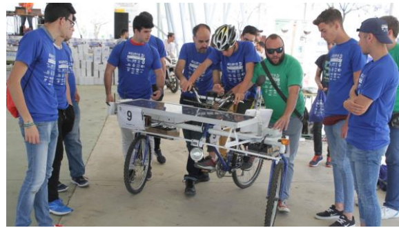
Figura 4: Instantánea de SUR18