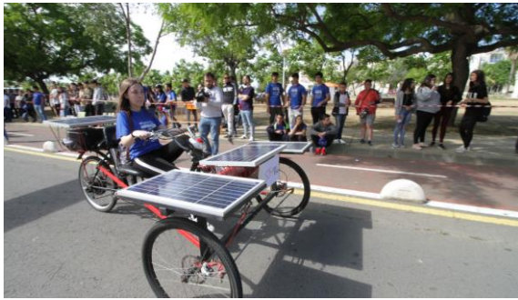
Figura 8: Instantánea de SUR18