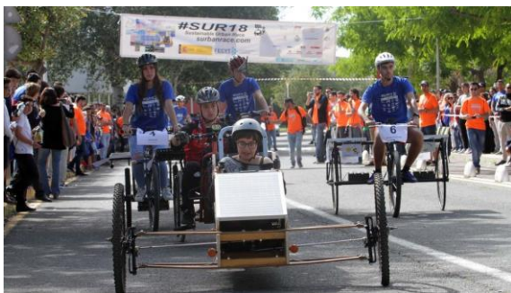
Figura 3: Instantánea de SUR18

En la página web http://surbanrace.com puede accederse a la información de todas las ediciones de la competición, imágenes, vídeos y documentación técnica.