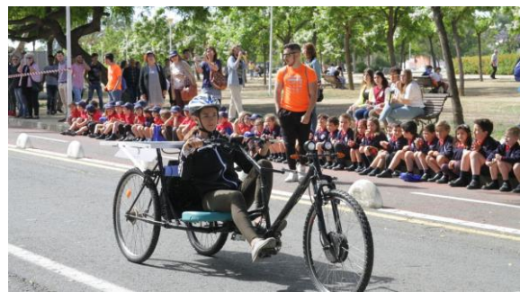
Figura 5: Instantánea de SUR18